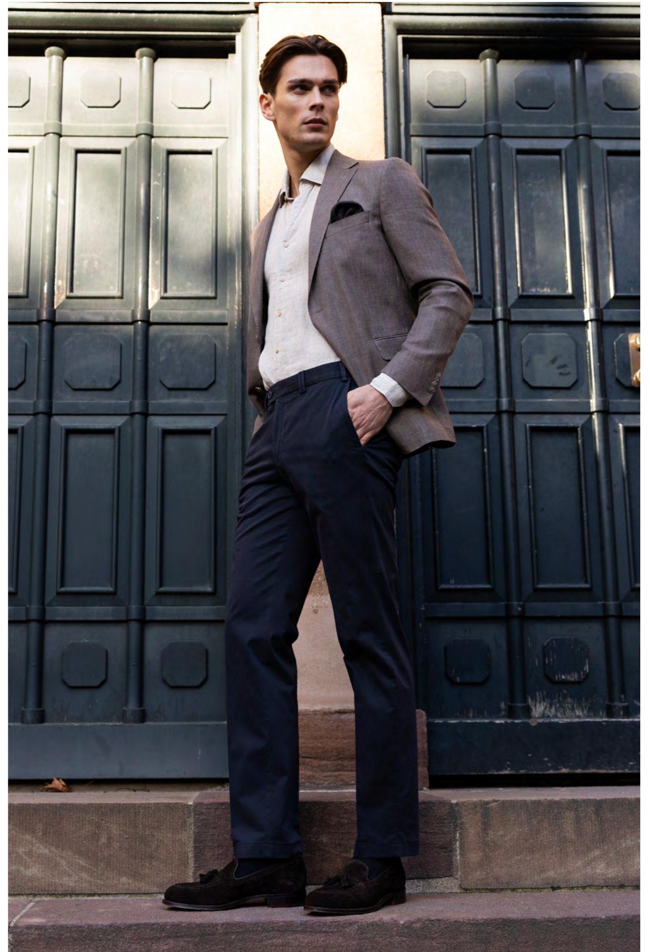
Dressler Blazer 5.900 kr.