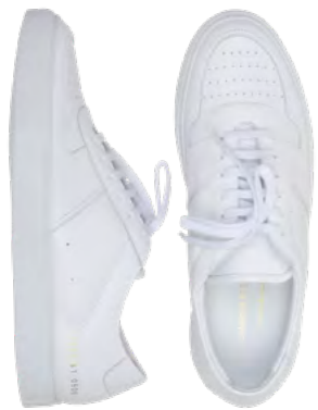
Common Projects Sneaker 3.300 kr.