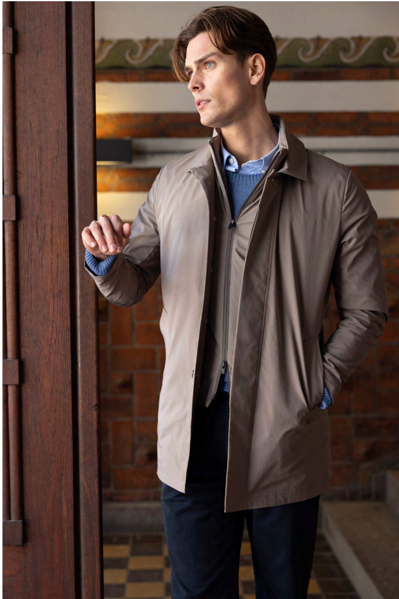
UBR Frakke 4.000 kr.