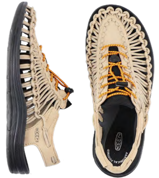
Keen Sandal 1.000 kr.