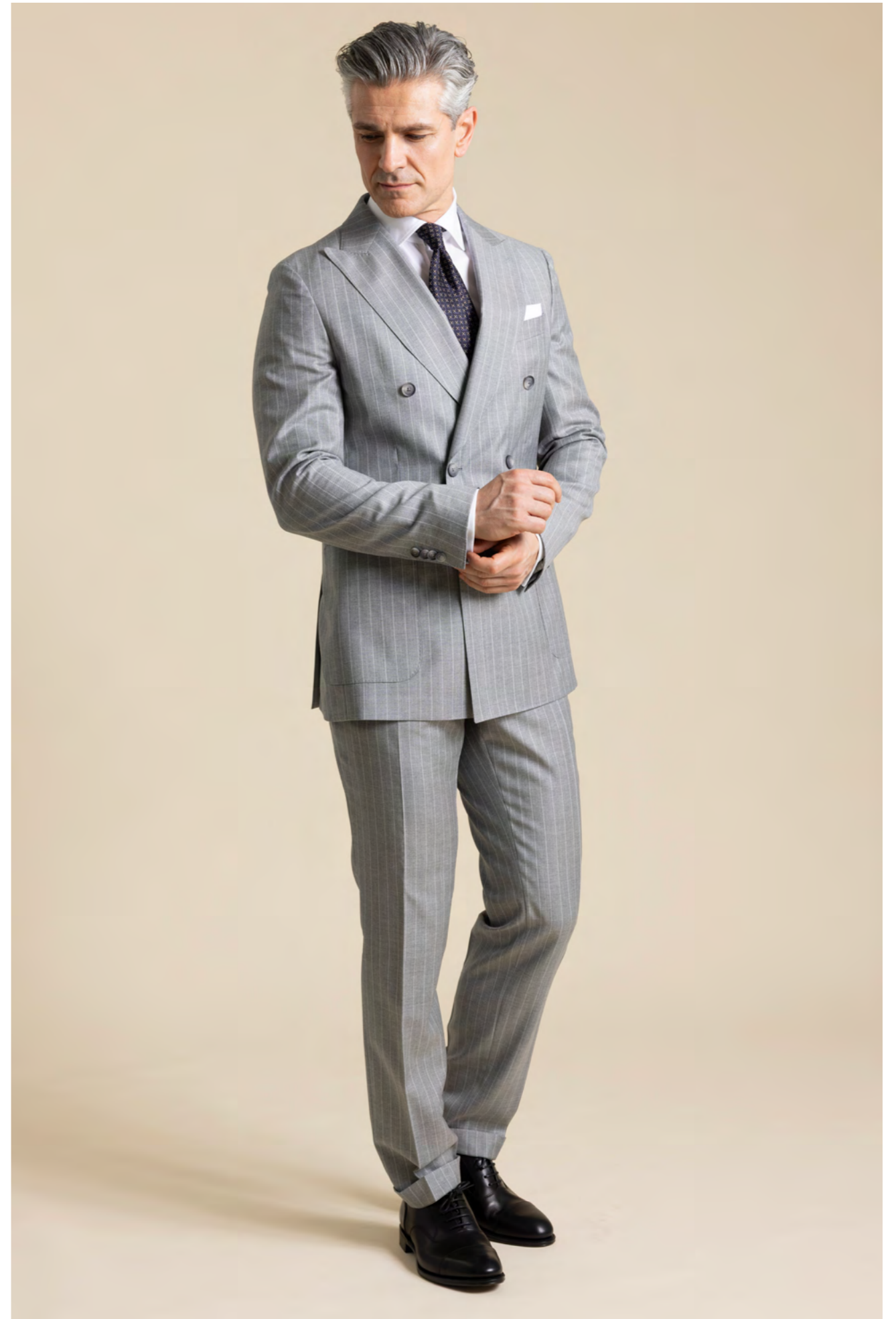
BOSS Dobbelttradedet jakkesæt 5.799 kr.