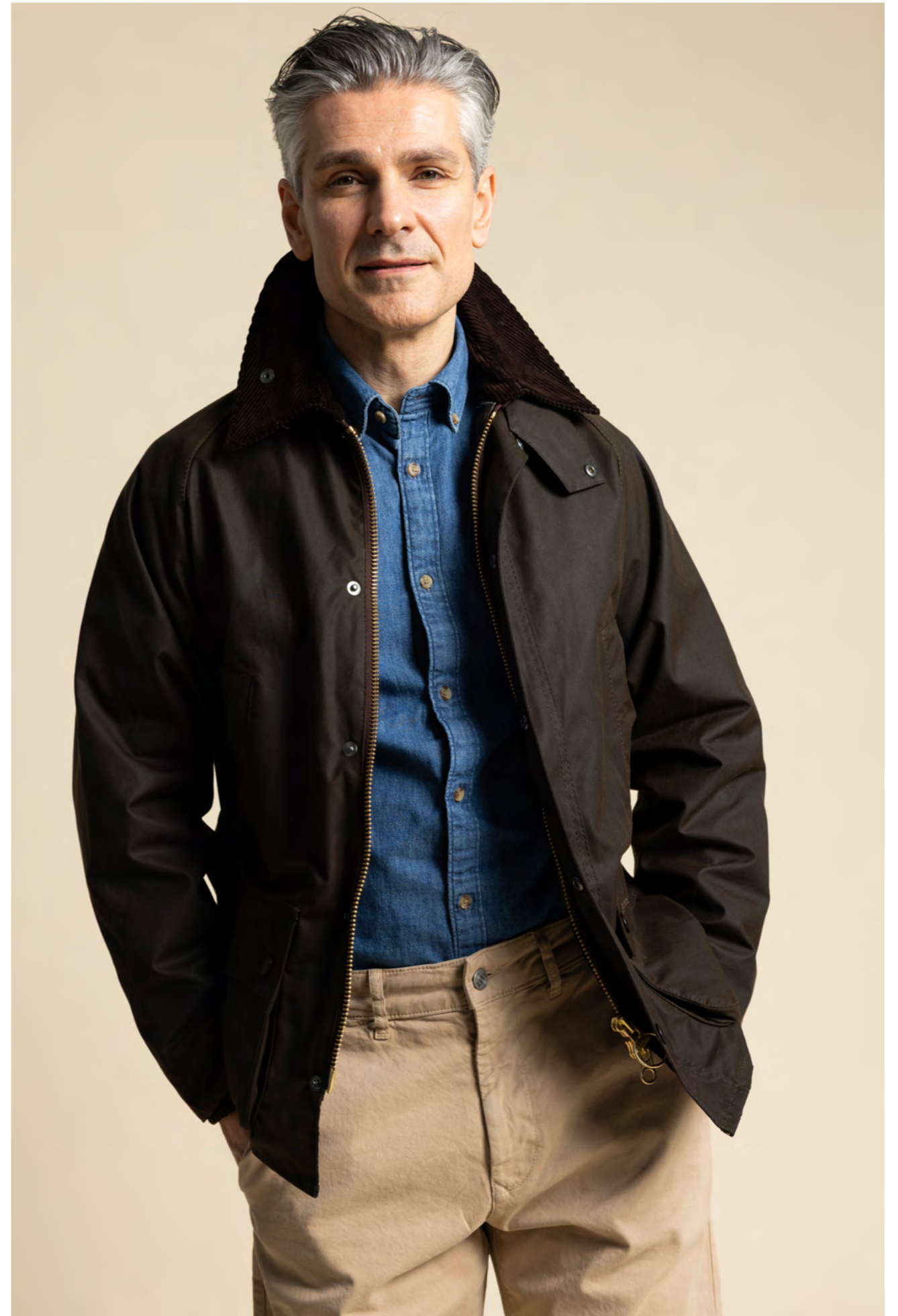
Barbour Jakke 3.000 kr.