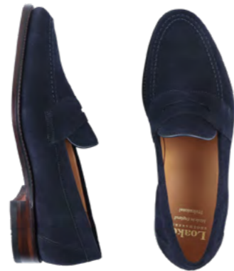
Loake Ruskinds loafer 2.500 kr.