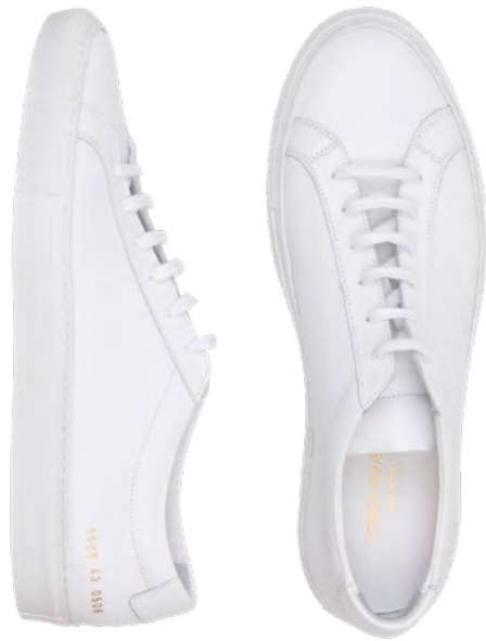
Common Projects Sneaker 3.000 kr.