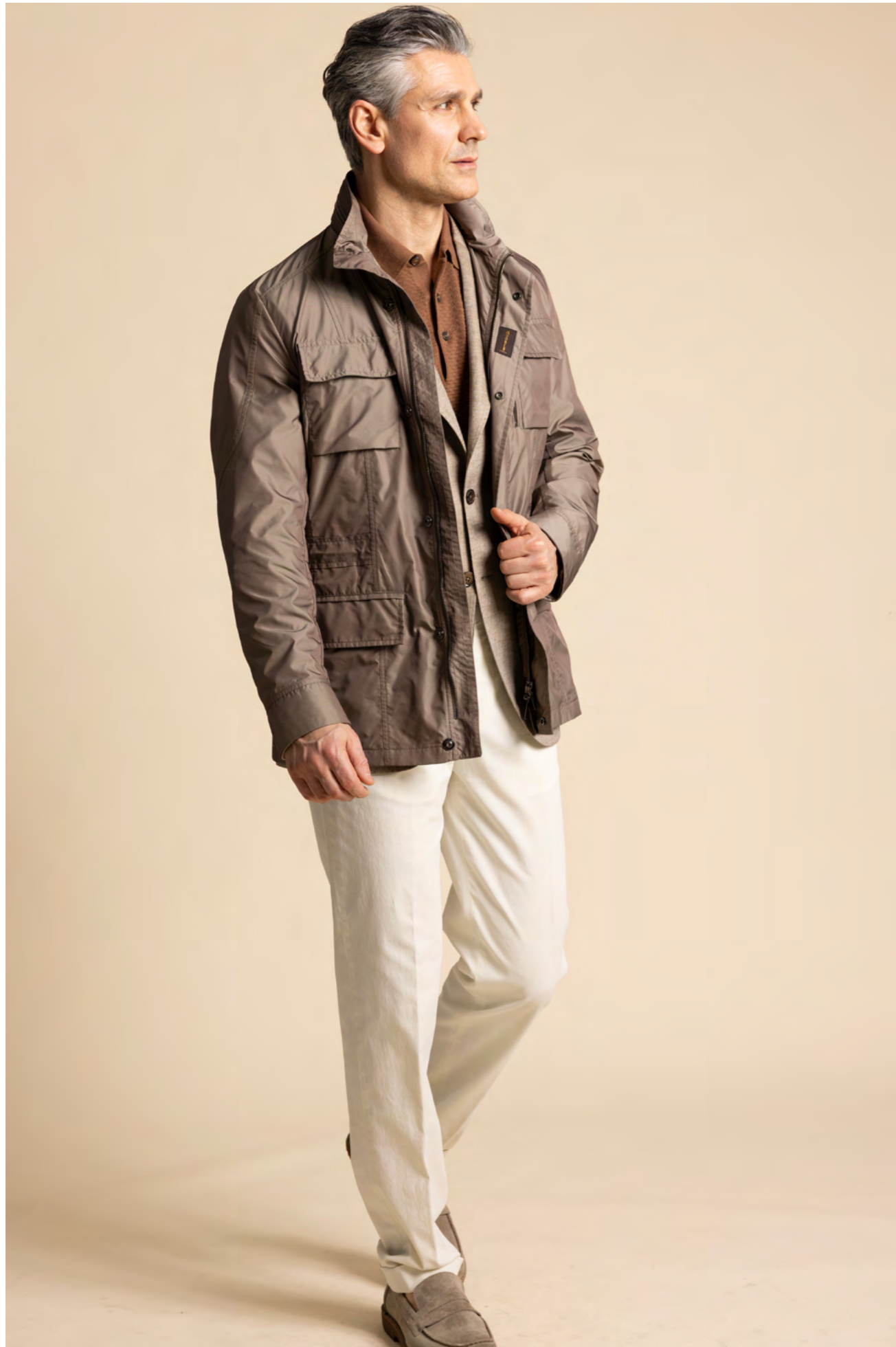
Moorer Field jacket 7.300 kr