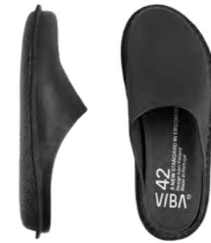
Vibae Roma 1.299 kr.