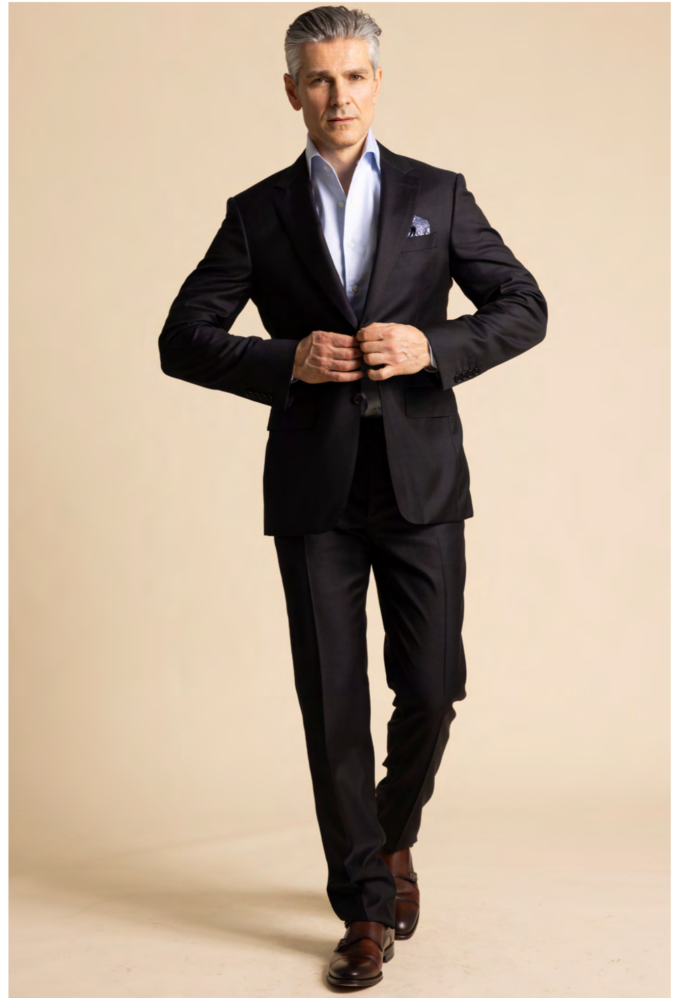
Canali Jakkesæt 11.000 kr.