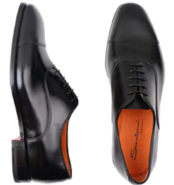
Santoni Lædersko 5.500 kr.