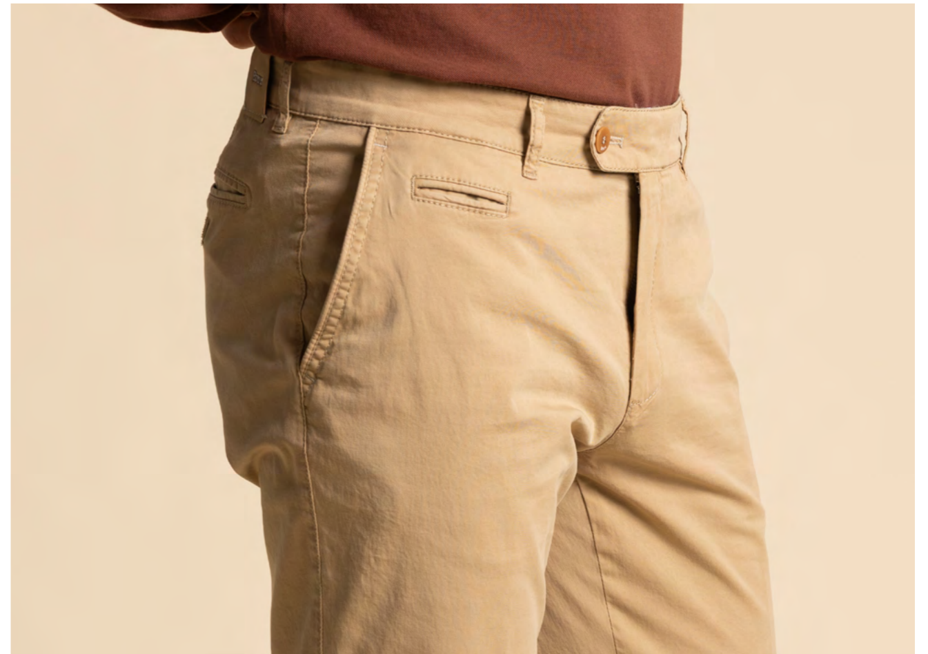
Brax Bomulds-bukser 1.000 kr.