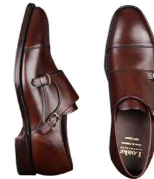
Loake Lædersko 3.000 kr.