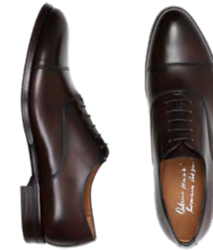
Antonio Maurizi Lædersko 3.000 kr.