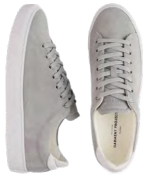
Garments Projects Sneaker 1.200 kr.