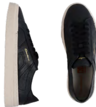
Santoni Sneaker 4.100 kr.