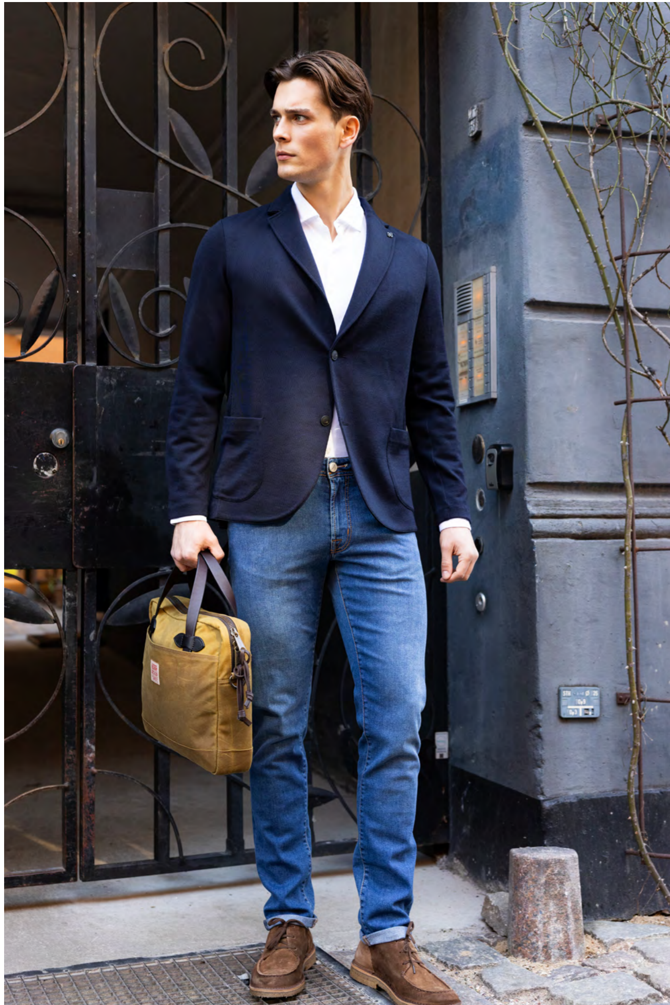
Gran Sasso Blazer 3.800 kr.