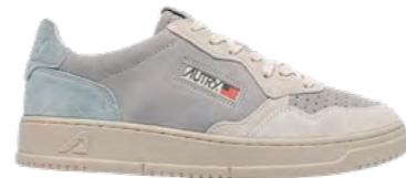
Autry Sneaker 1.400 kr.