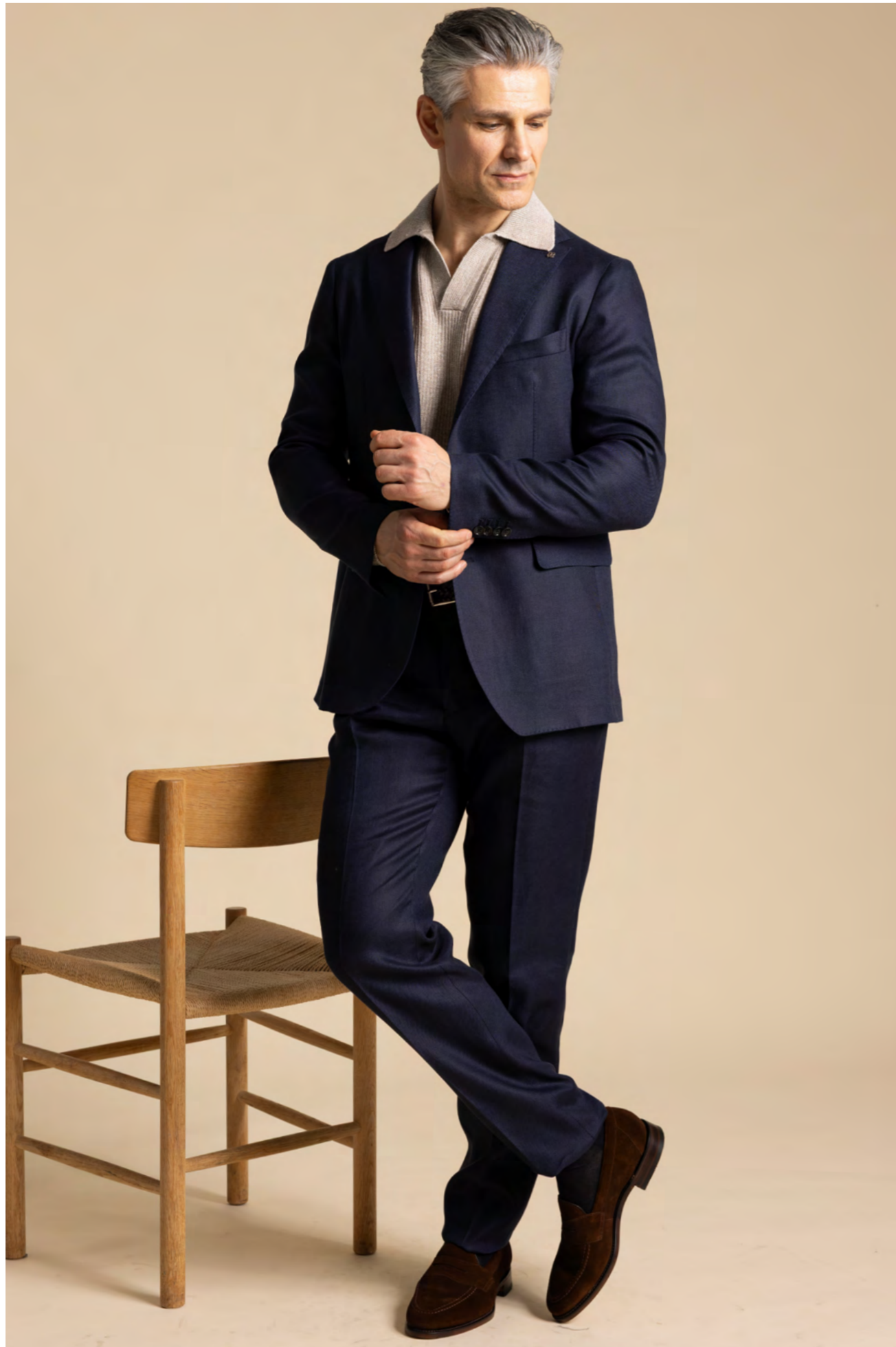
Tagliatore Jakkesæt 7.000 kr.