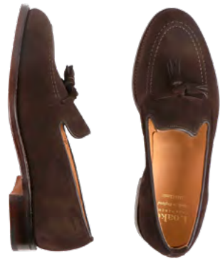
Loake Ruskinds loafer 2.600 kr.