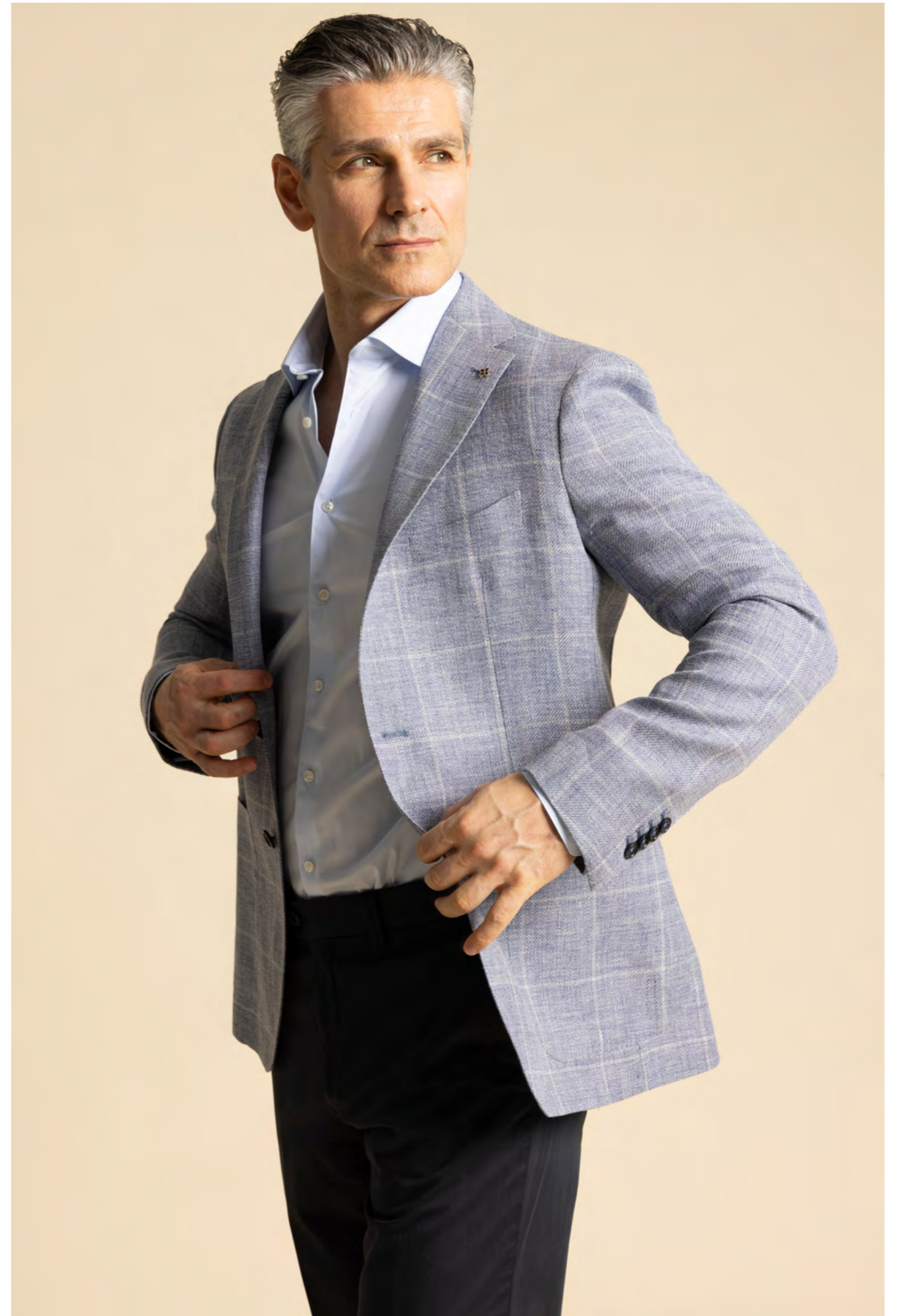
Tagliatore Blazer 5.200 kr.