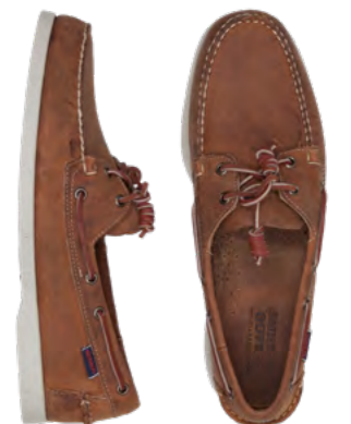
Sebago Sejlrsko 1.400 kr.