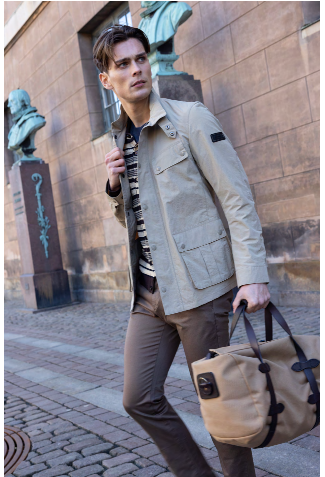
Barbour international Jakke 2.000 kr.