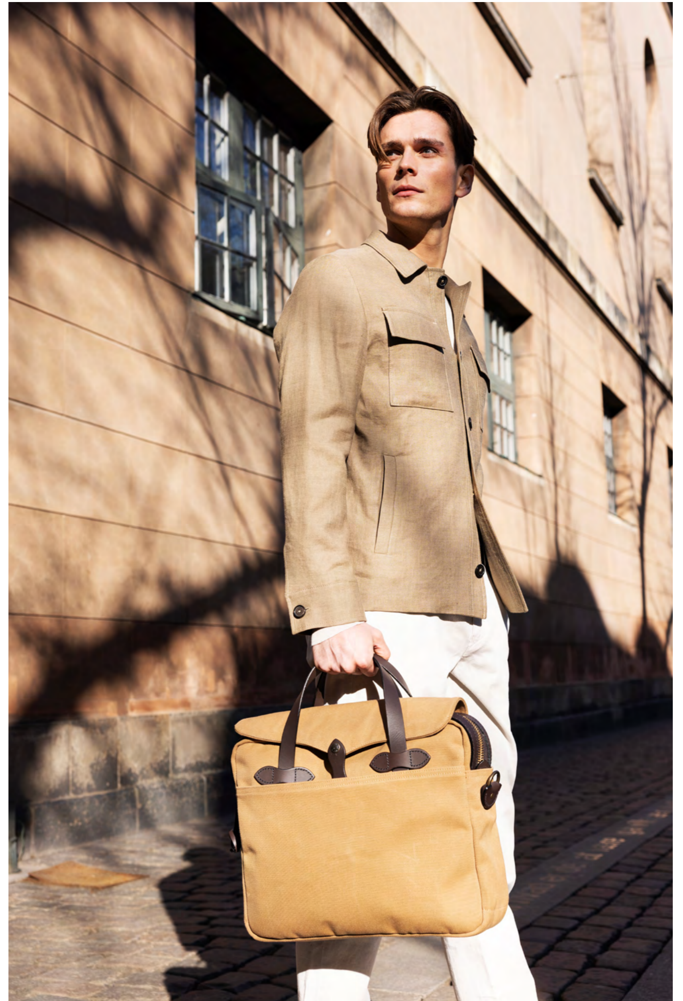
Dressler Skjortejakke 4.700 kr.