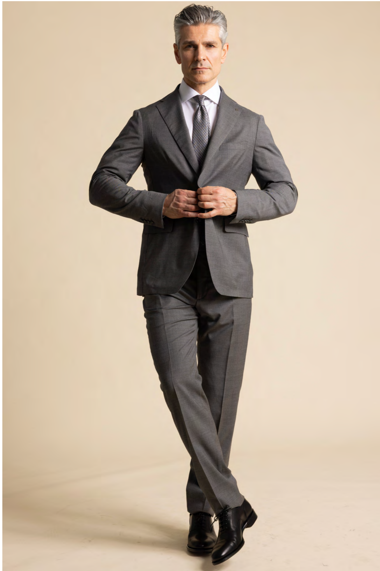
Tagliatore Jakkesæt 6.500 kr.