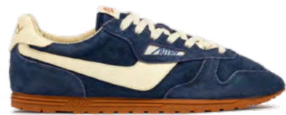
Autry Sneaker 1.400 kr.