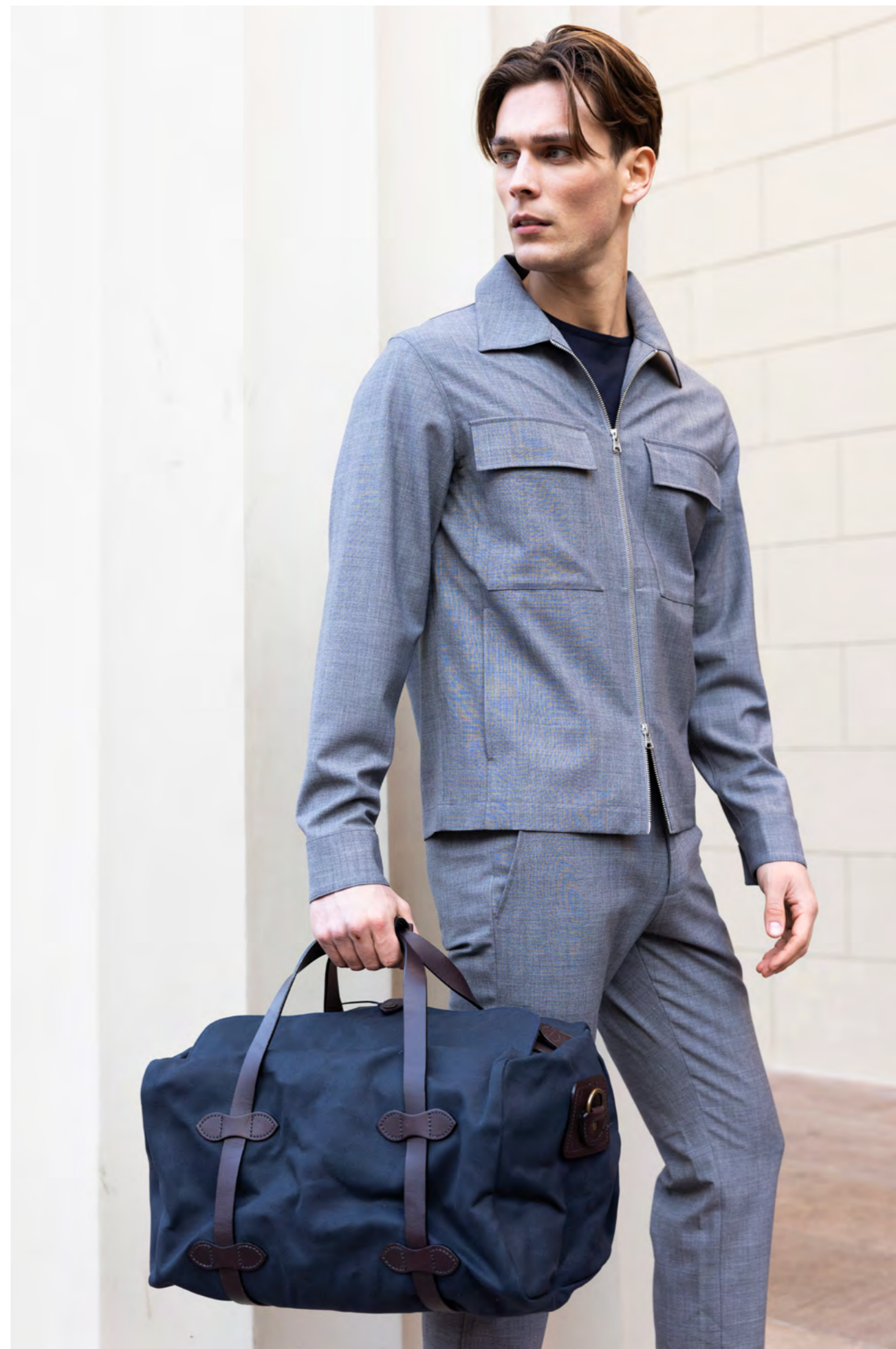
Filson Medium duffel bag 4.500 kr.