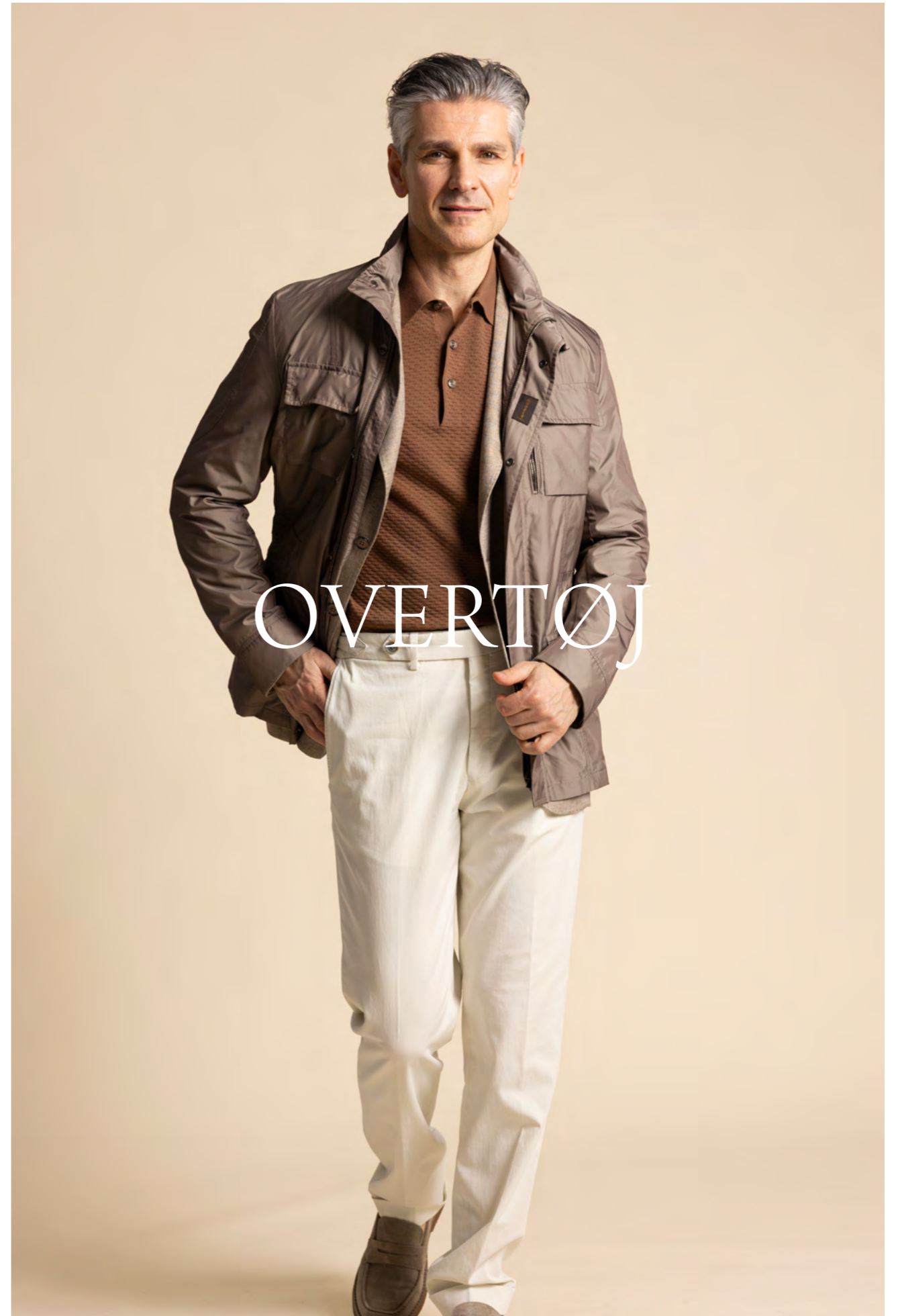
Moorer Fieldjacket 7.300 kr.