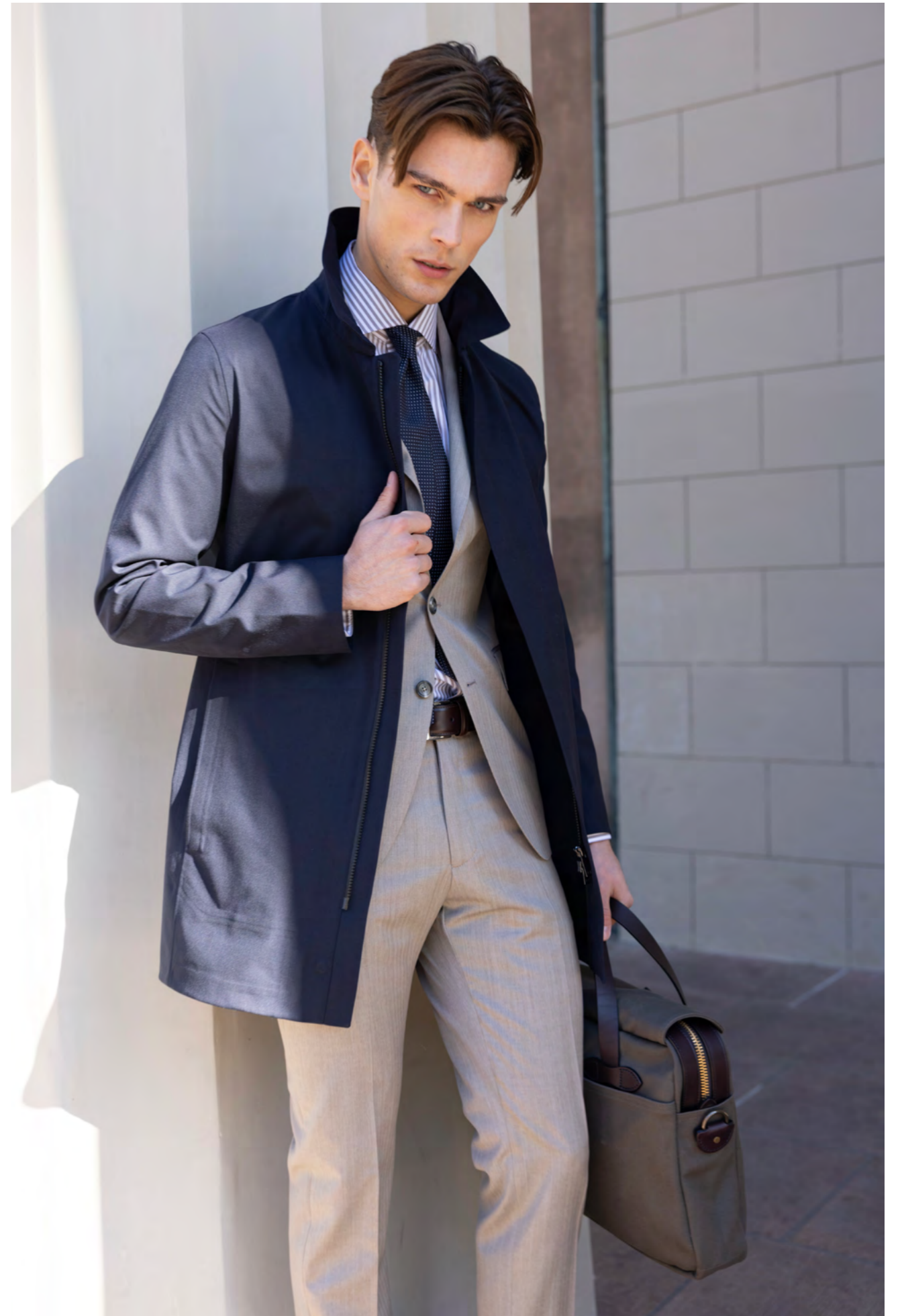
UBR Frakke 6.000 kr.