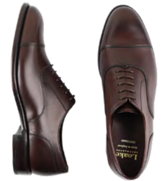
Loake Lædersko 3.200 kr.