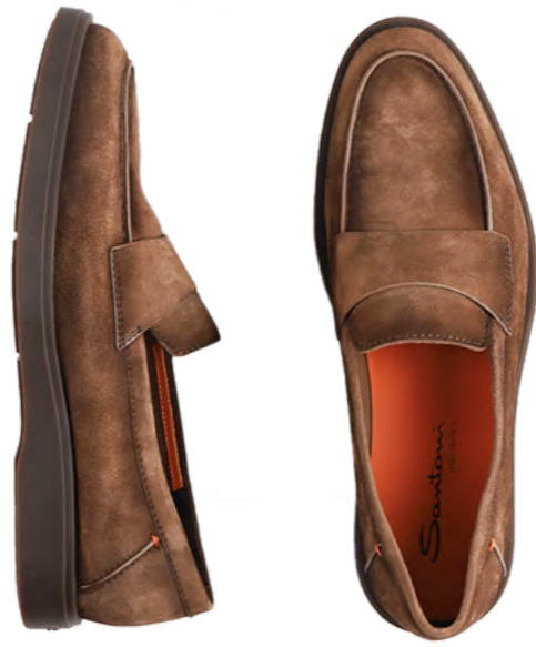
Santoni Ruskinds loafer 6.000 kr.