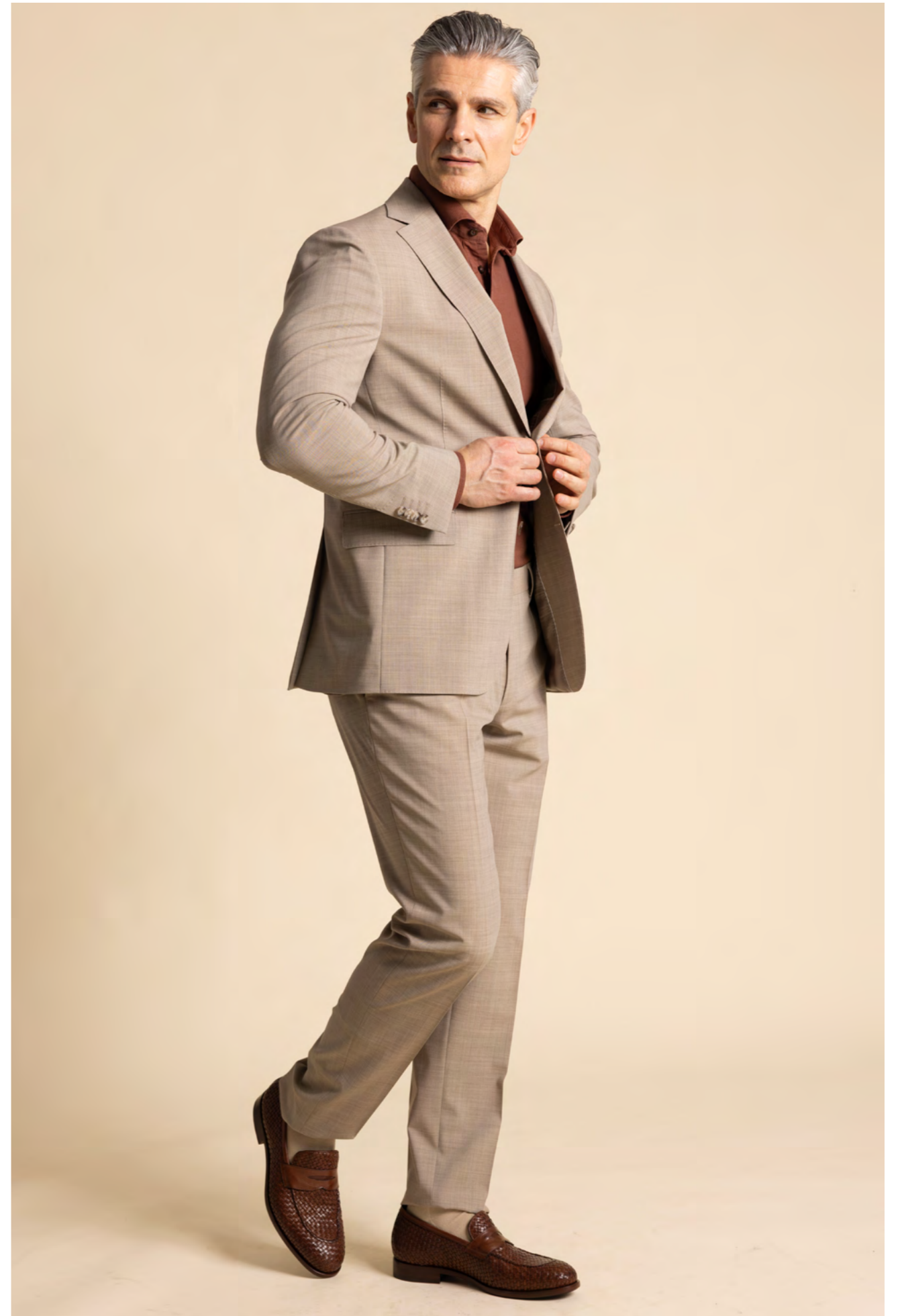
Dressler Jakkesæt 5.900 kr.