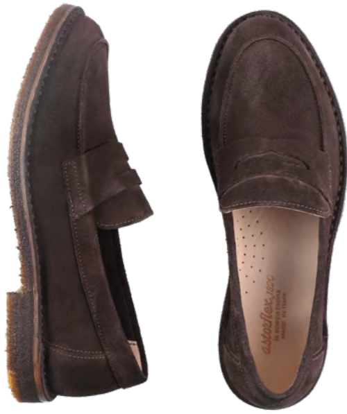
Astorflex Ruskinds loafer 2.000 kr.