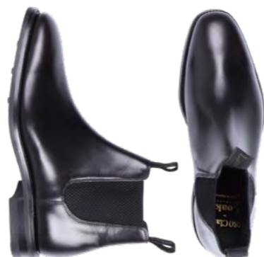
Loake Læder Chelsea boot 2.900 kr.