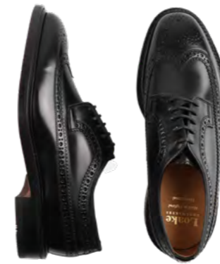
Loake Lædersko 2.600 kr.