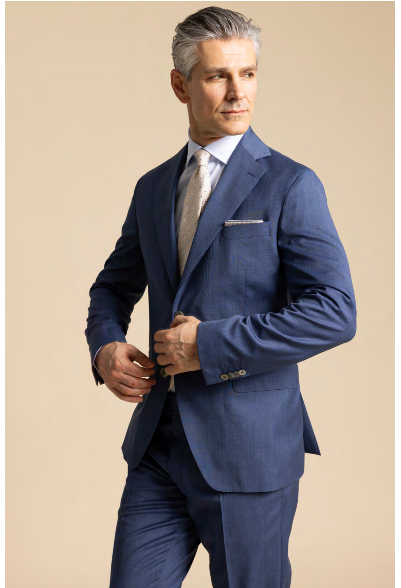
Oscar Jacobson Jakkesæt 5.300 kr.