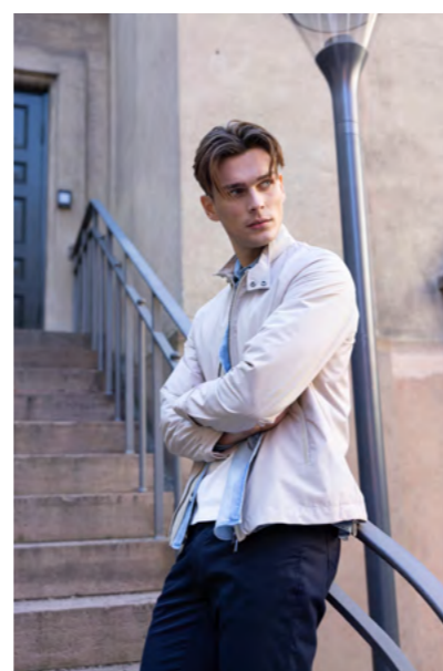
Paul & Shark