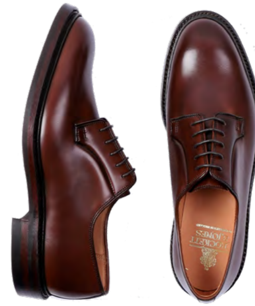
Crockett and Jones Lædersko 5.900 kr.