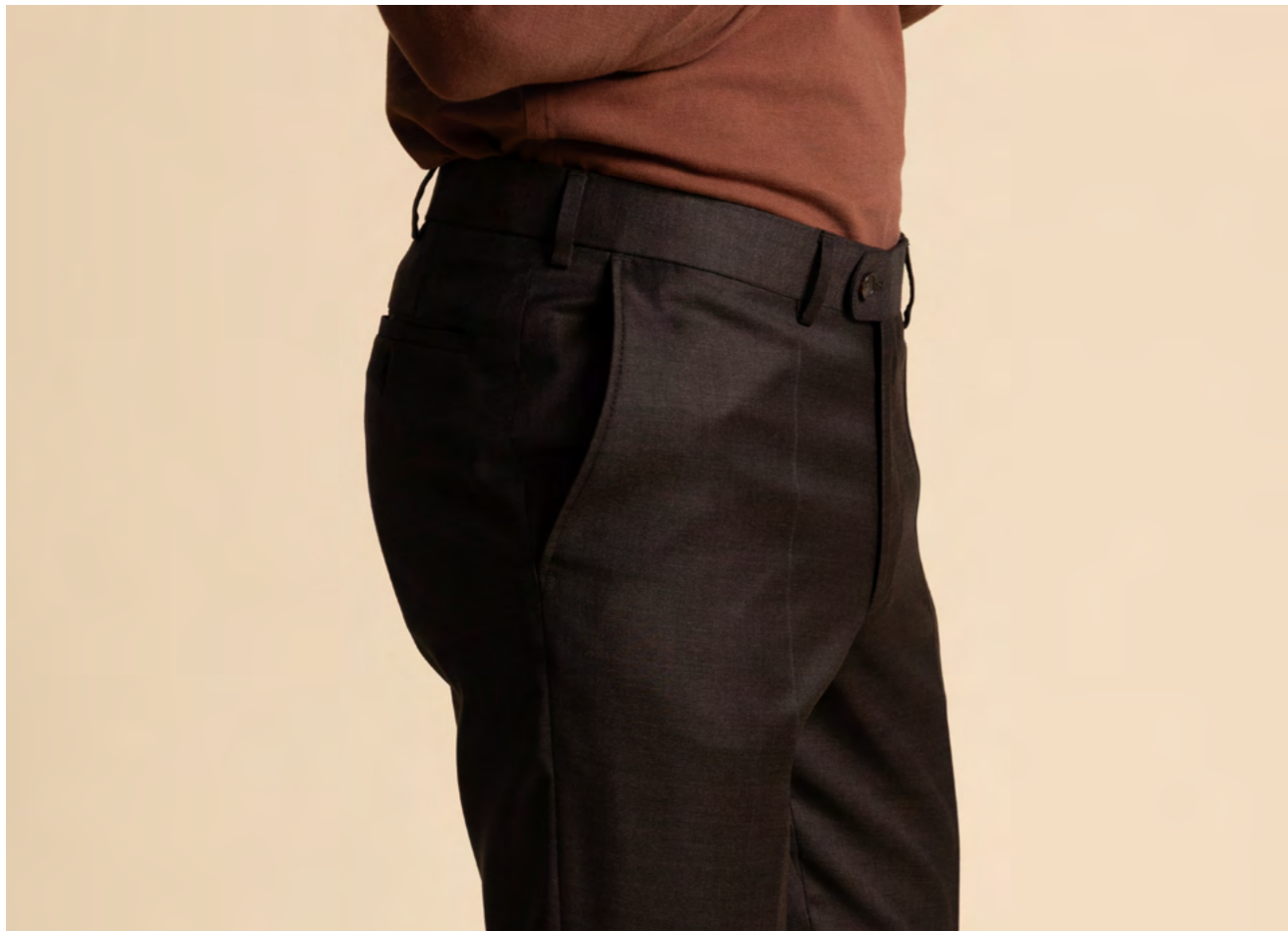
Dressler Uldbukser 2.000 kr.