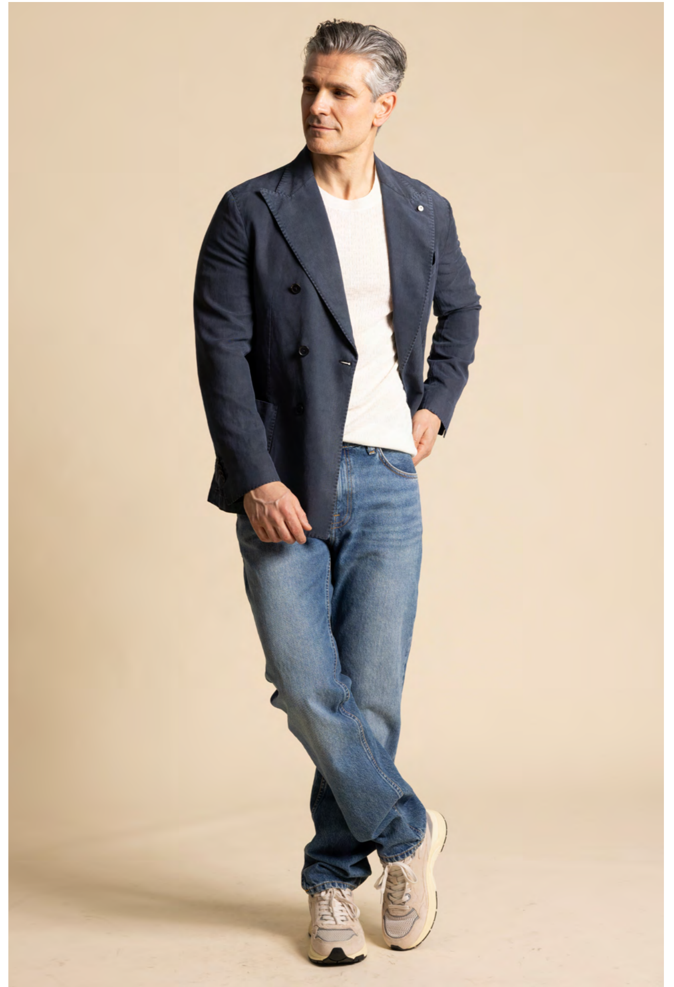
L.B.M.1911 Dobbelttradedt blazer 4.100 kr.