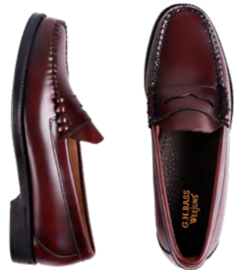
G.H. BASS Loafer 1.600 kr.