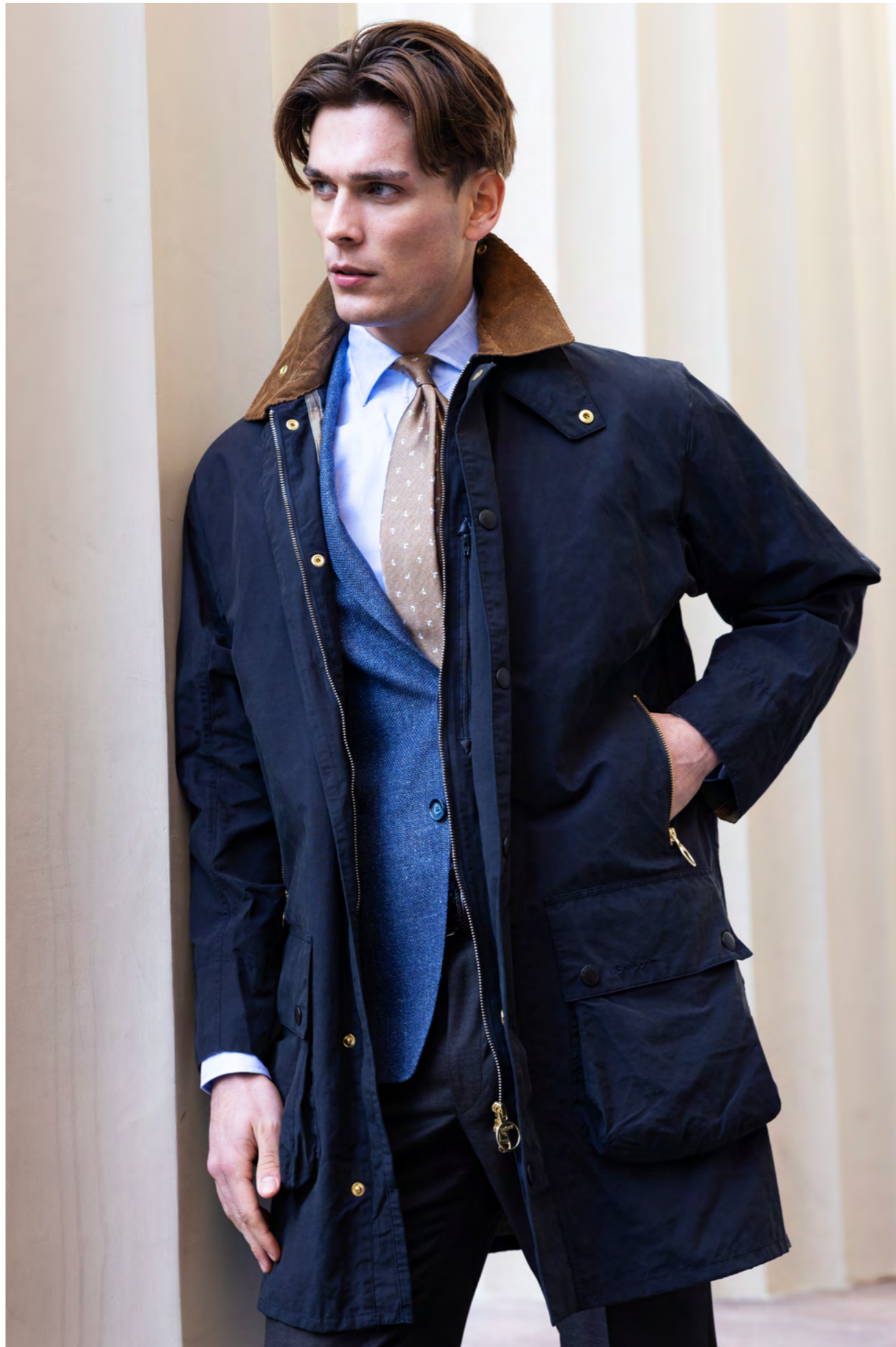
Barbour Frakke 3.200 kr.