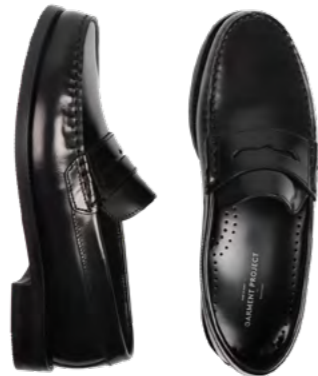
Garment projects Loafer 1.500 kr.