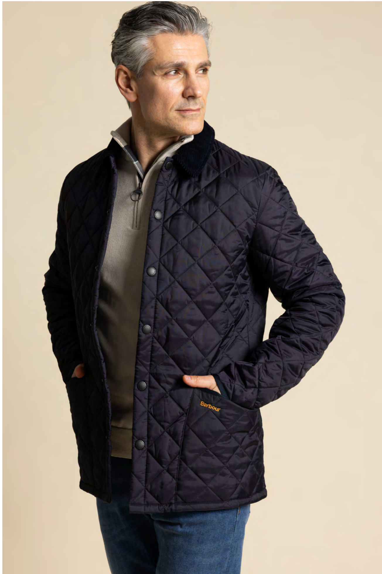
Barbour Jakke 1.400 kr.