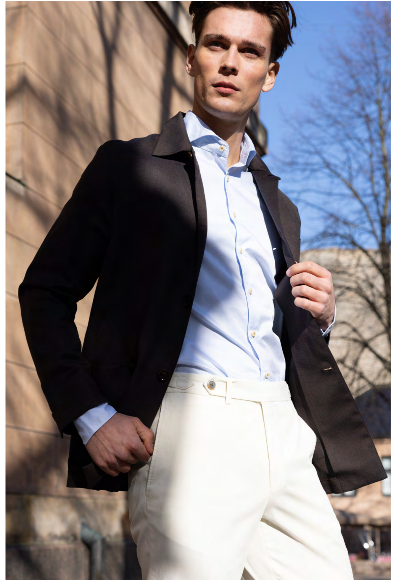
Hilt Bukser 1.600 kr.