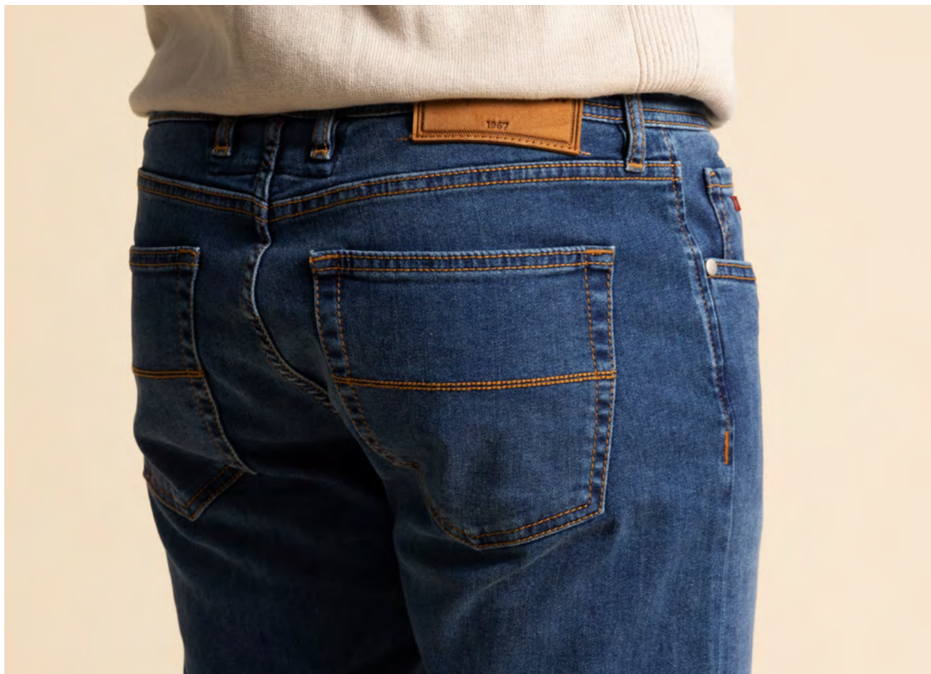
Tramarossa Jeans 2.300 kr.