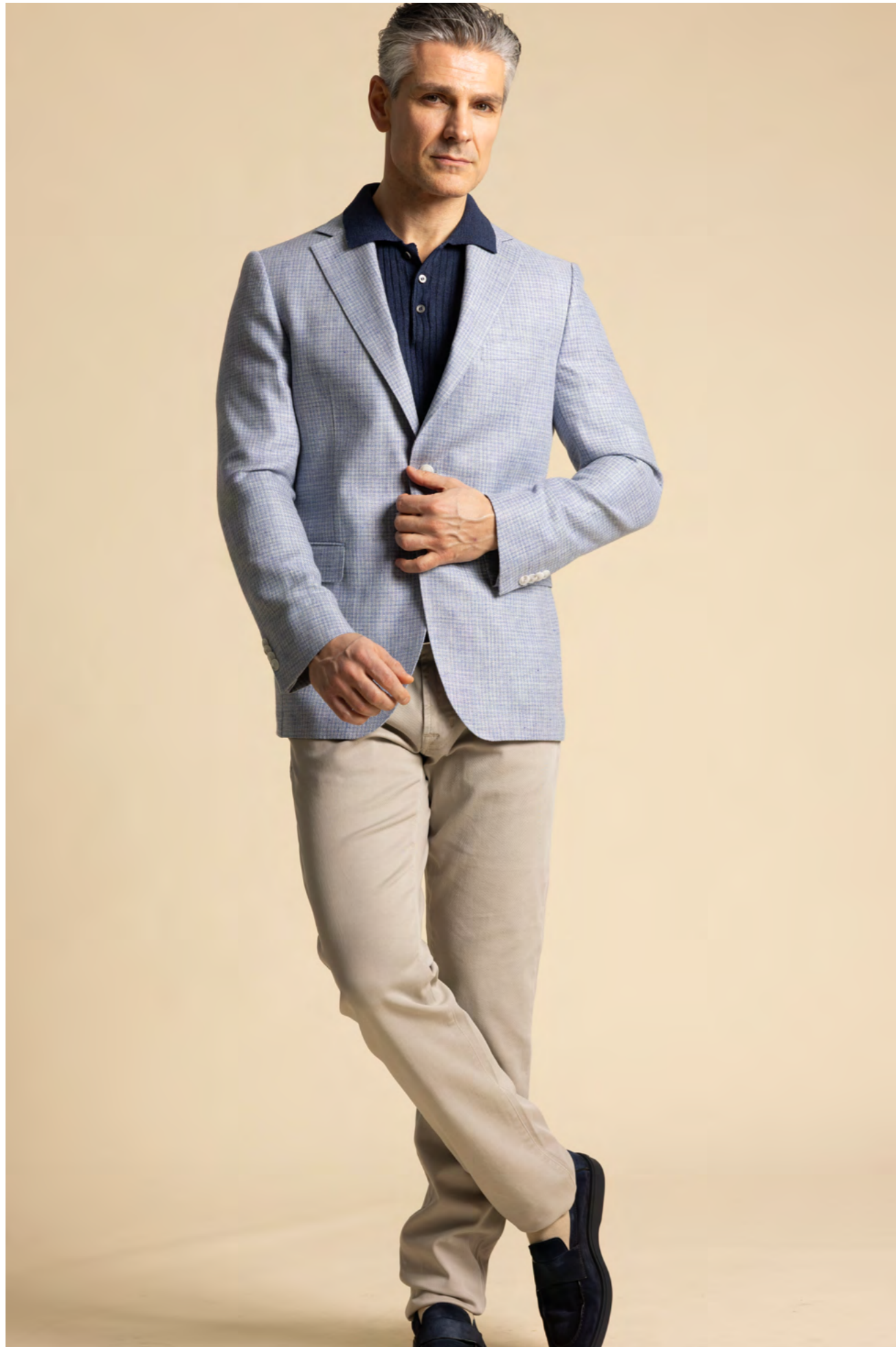
Dressler Blazer 5.000 kr.