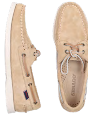
Sebago Sejlrsko 1.400 kr.