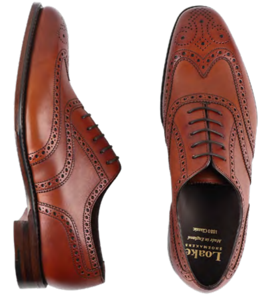
Loake Lædersko 3.200 kr.