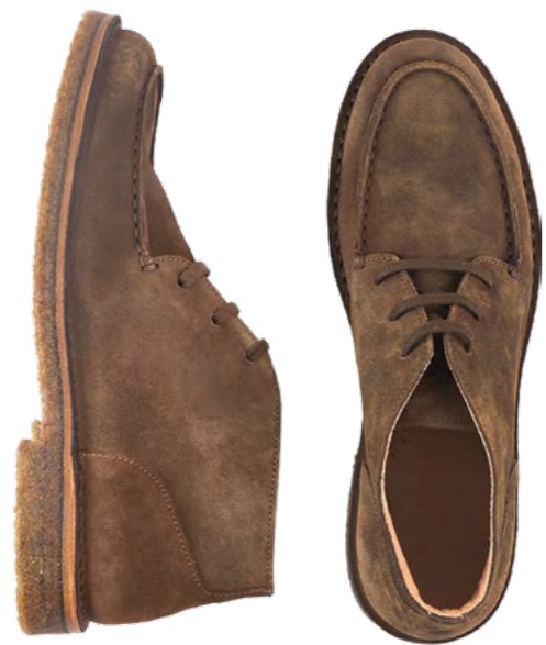
Astorflex Dukeflex 1.799 kr.