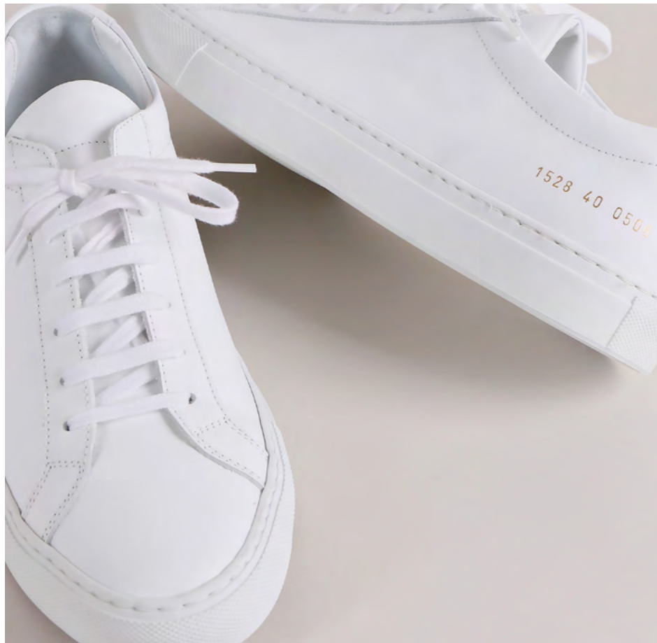
COMMON PROJECTS: Sneaker, kr. 3.000