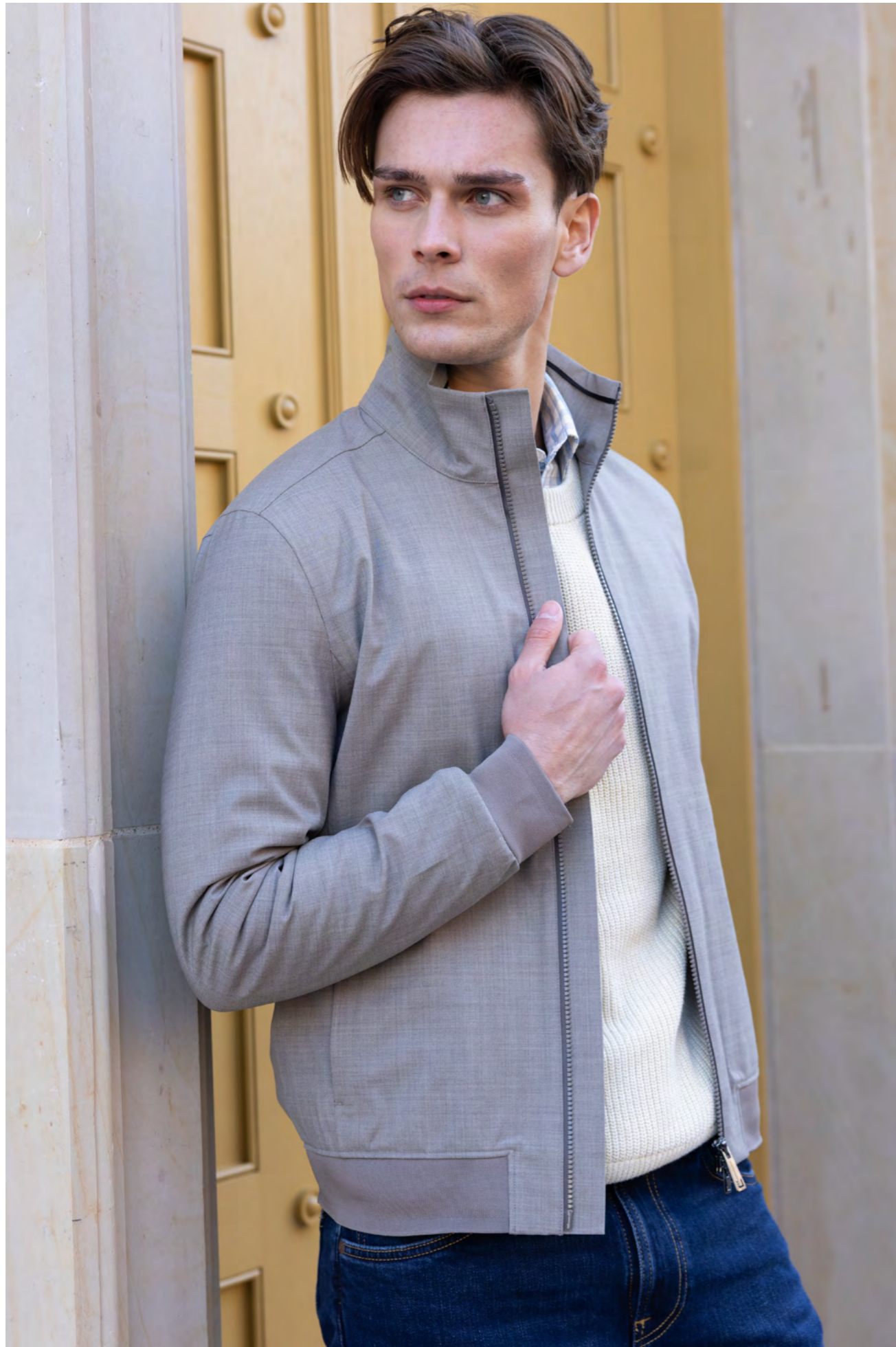
UBR Jakke 4.500 kr.