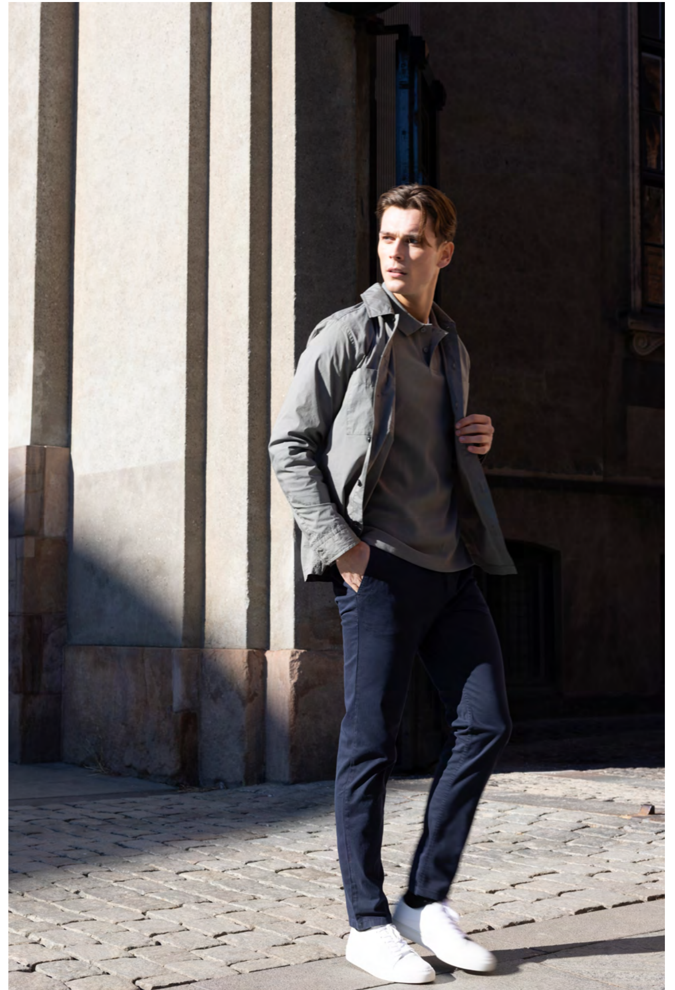
BOSS Skjortejakke 999 kr.