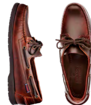
Sebago Sejlrsko 1.400 kr.