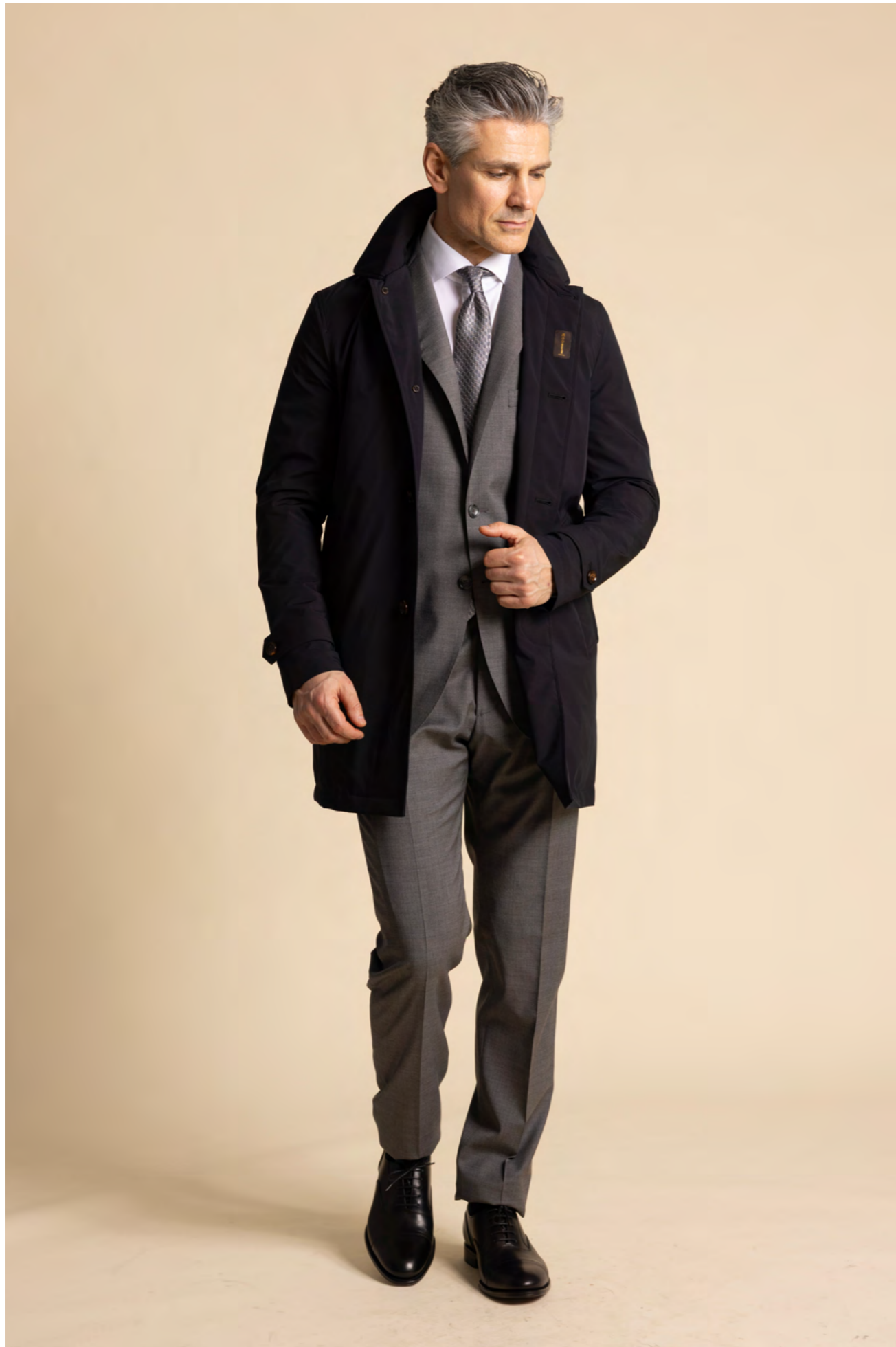
Moorer Jakke 7.900 kr.