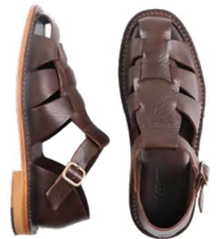
Astorflex Sandal 1.900 kr.