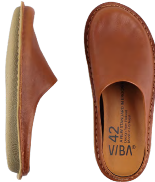
Vibae Roma 1.299 kr.