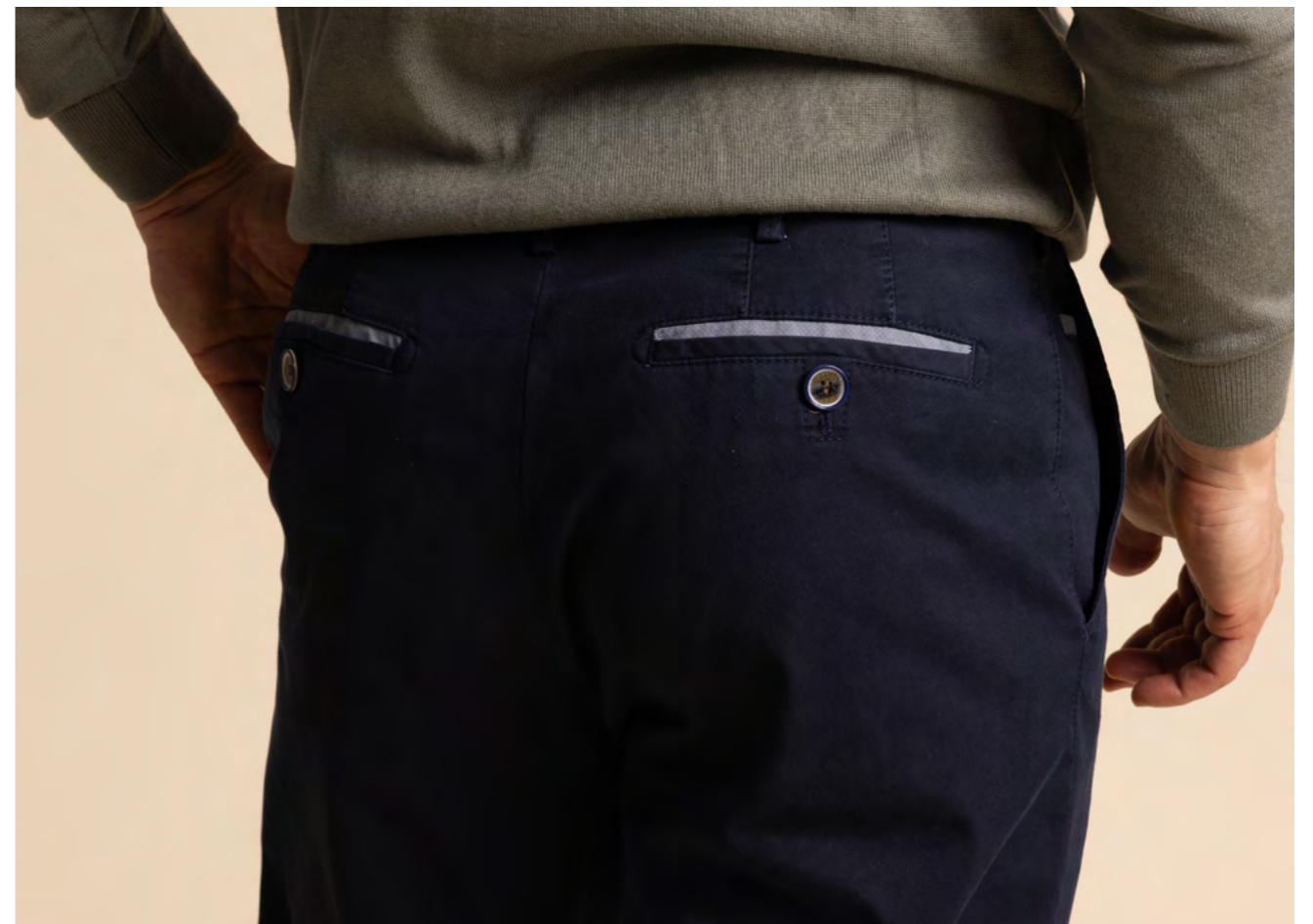
Hild Bukser 1.600 kr.