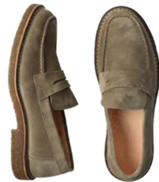
Astorflex Ruskinds loafer 1.800 kr.