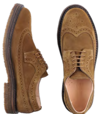
Astorflex Ruskindssko 1.900 kr.