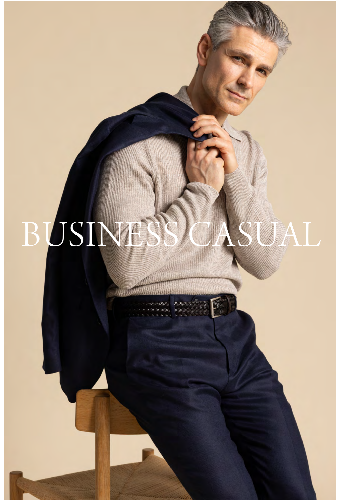
Tagliatore Jakkesæt 7.000 kr.