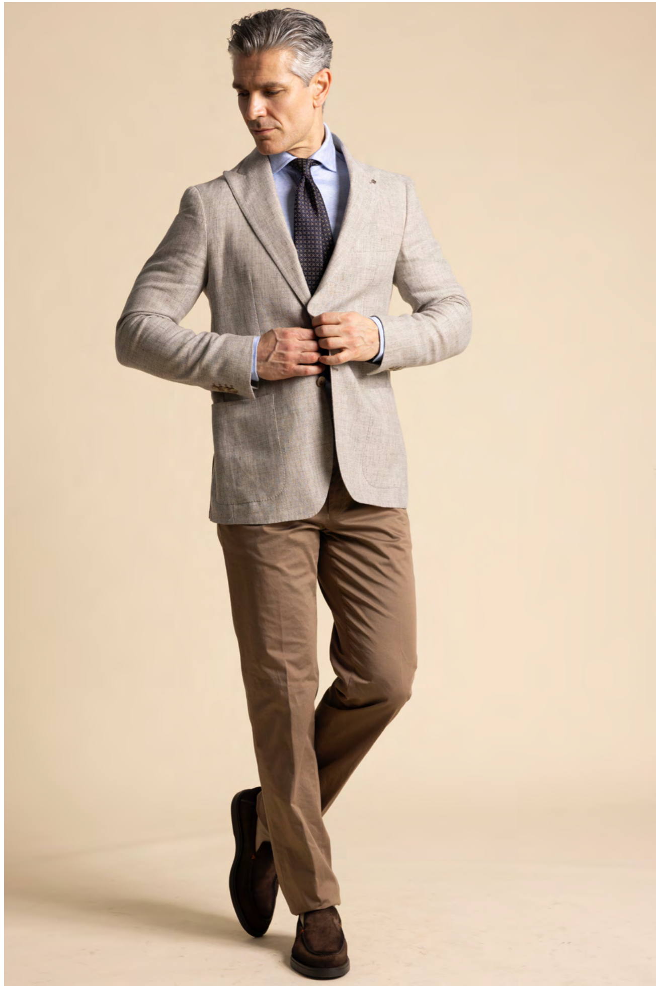
Tagliatore Blazer 5.200 kr.