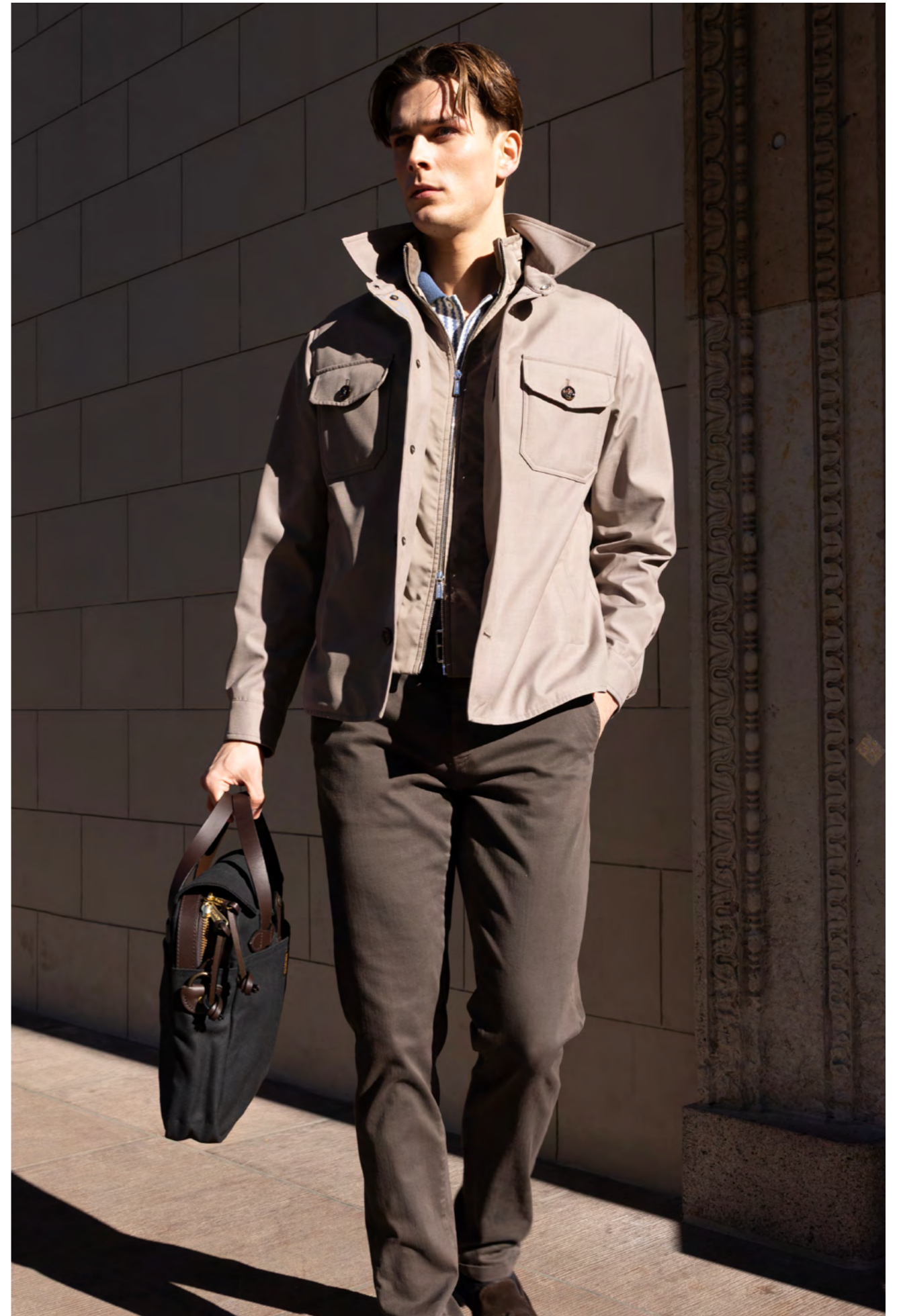
Moorer Jakke 9.200 kr.