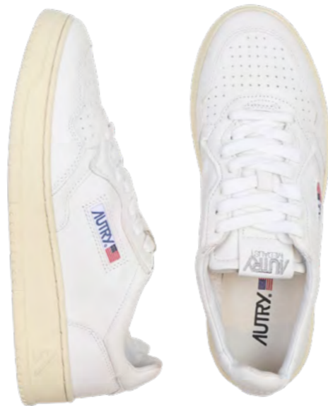
Autry Sneaker 1.300 kr.