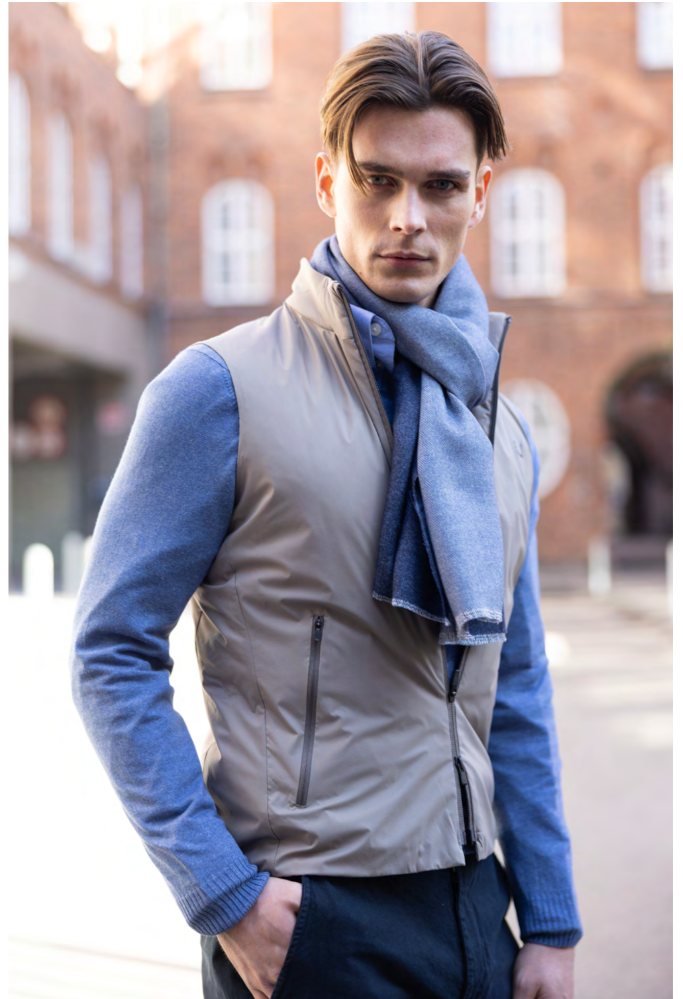
UBR Vest 2.300 kr.