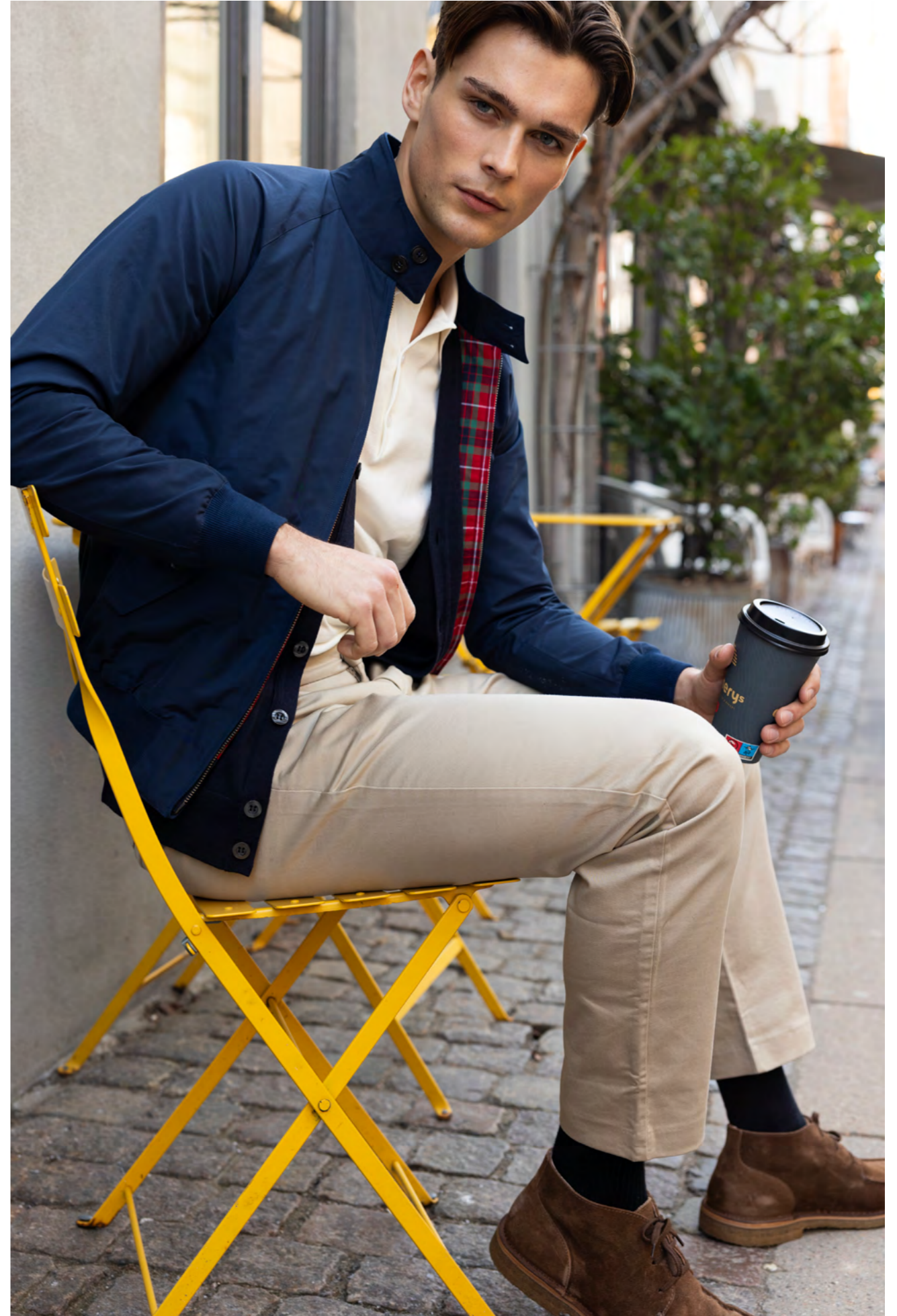
Baracuta Jakke 3.300 kr.