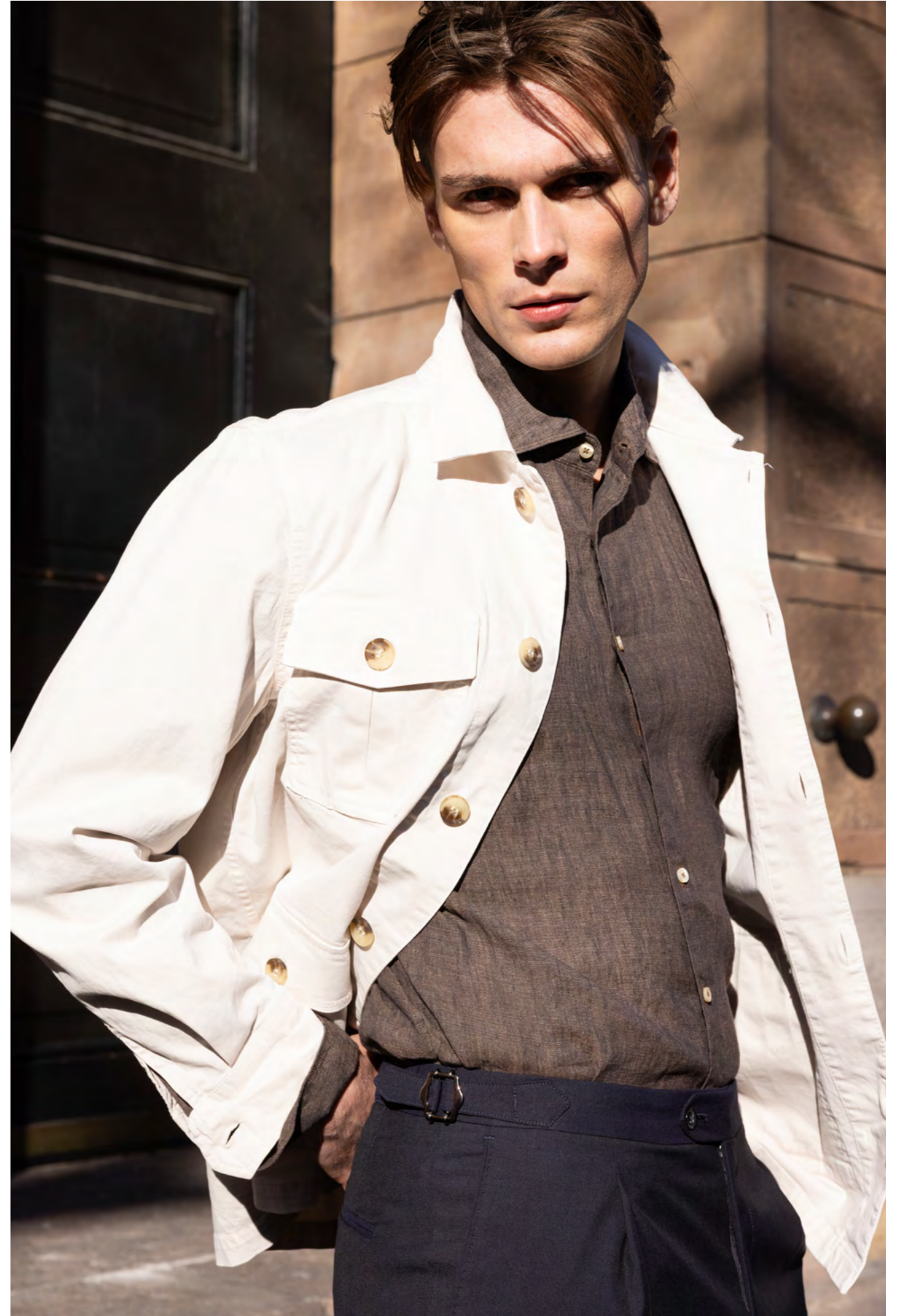
Oscar Jacobson Skjortejakke 1.599 kr.