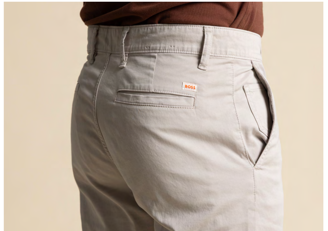
Tramarossa Bomuldsbukser 2.700 kr.