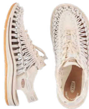
Keen Sandal 1.000 kr.