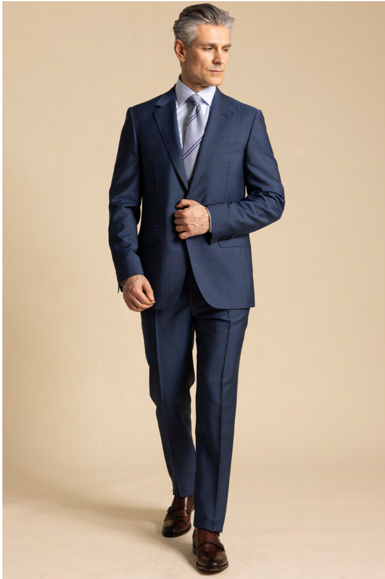
Canali Jakkesæt 12.000 kr.