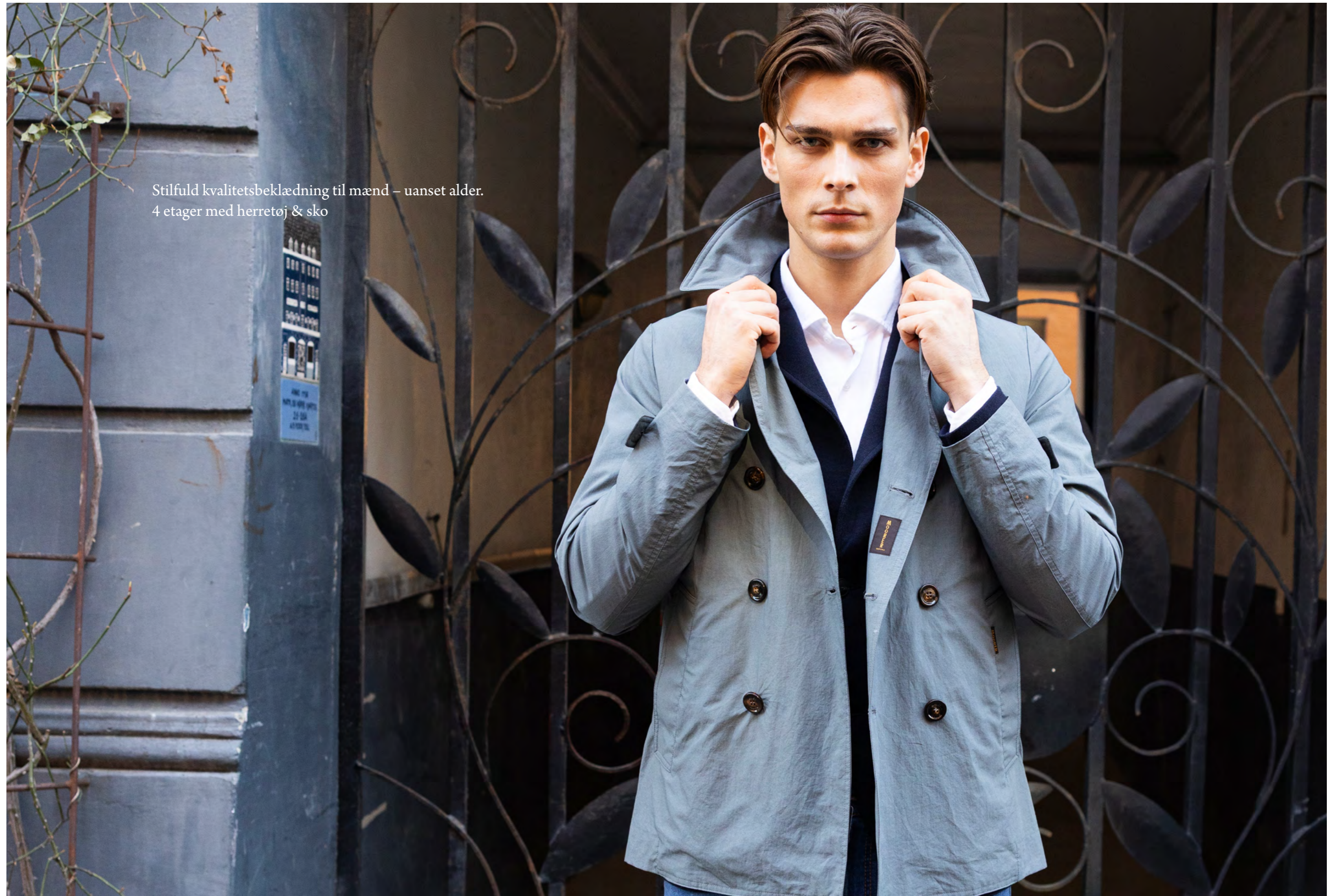
Moorer Jakke 8.600 kr.

Stilfuld kvalitetsbeklædning til mænd – uanset alder. 4 etager med herretøj & sko