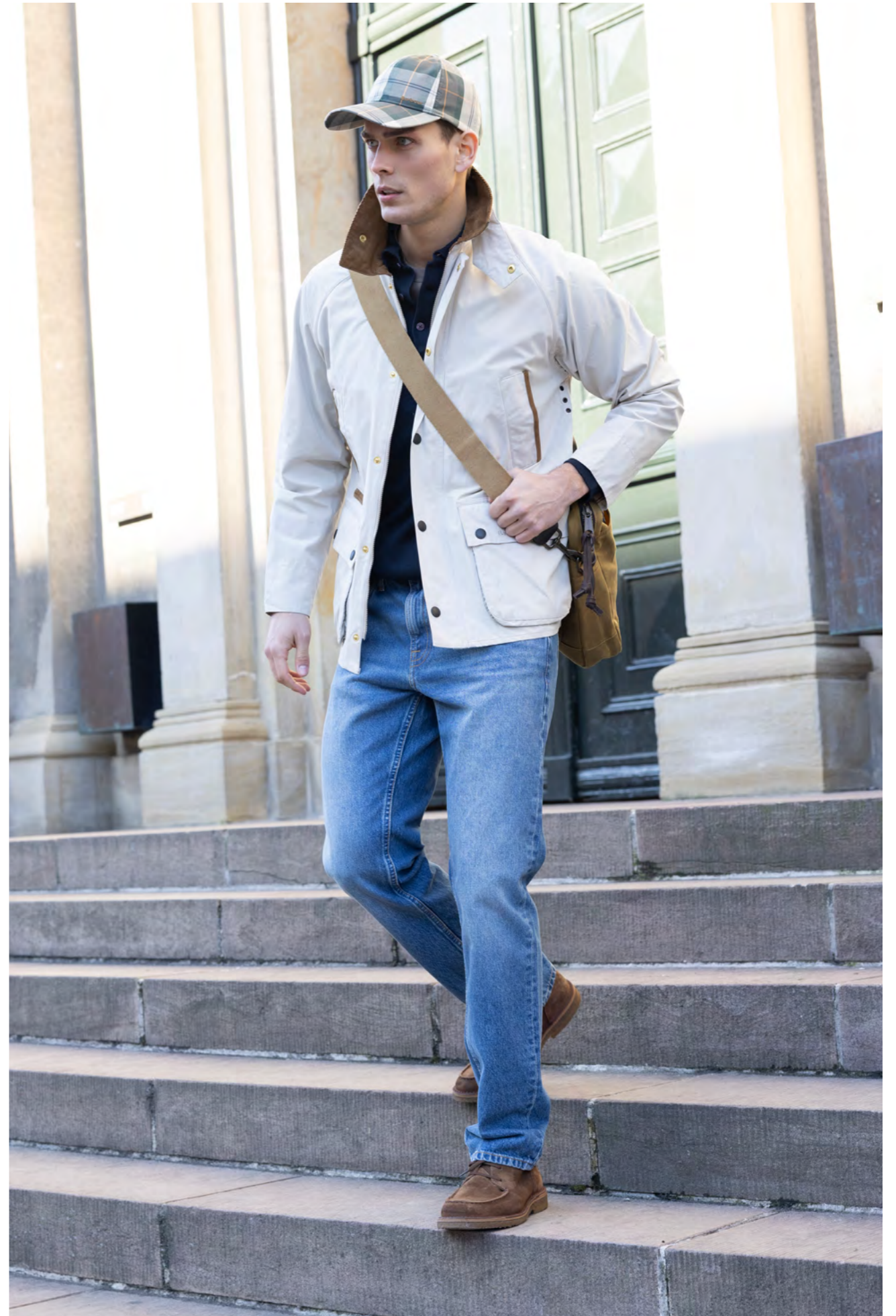
Barbour Jakke 2.600 kr.