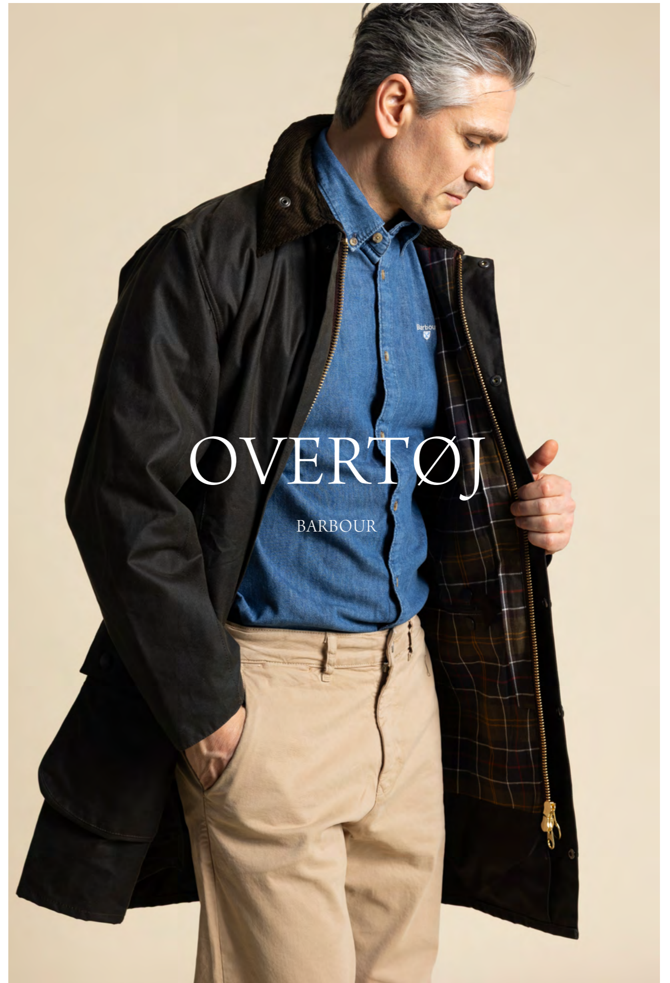
Barbour Jakke 3.200 kr.