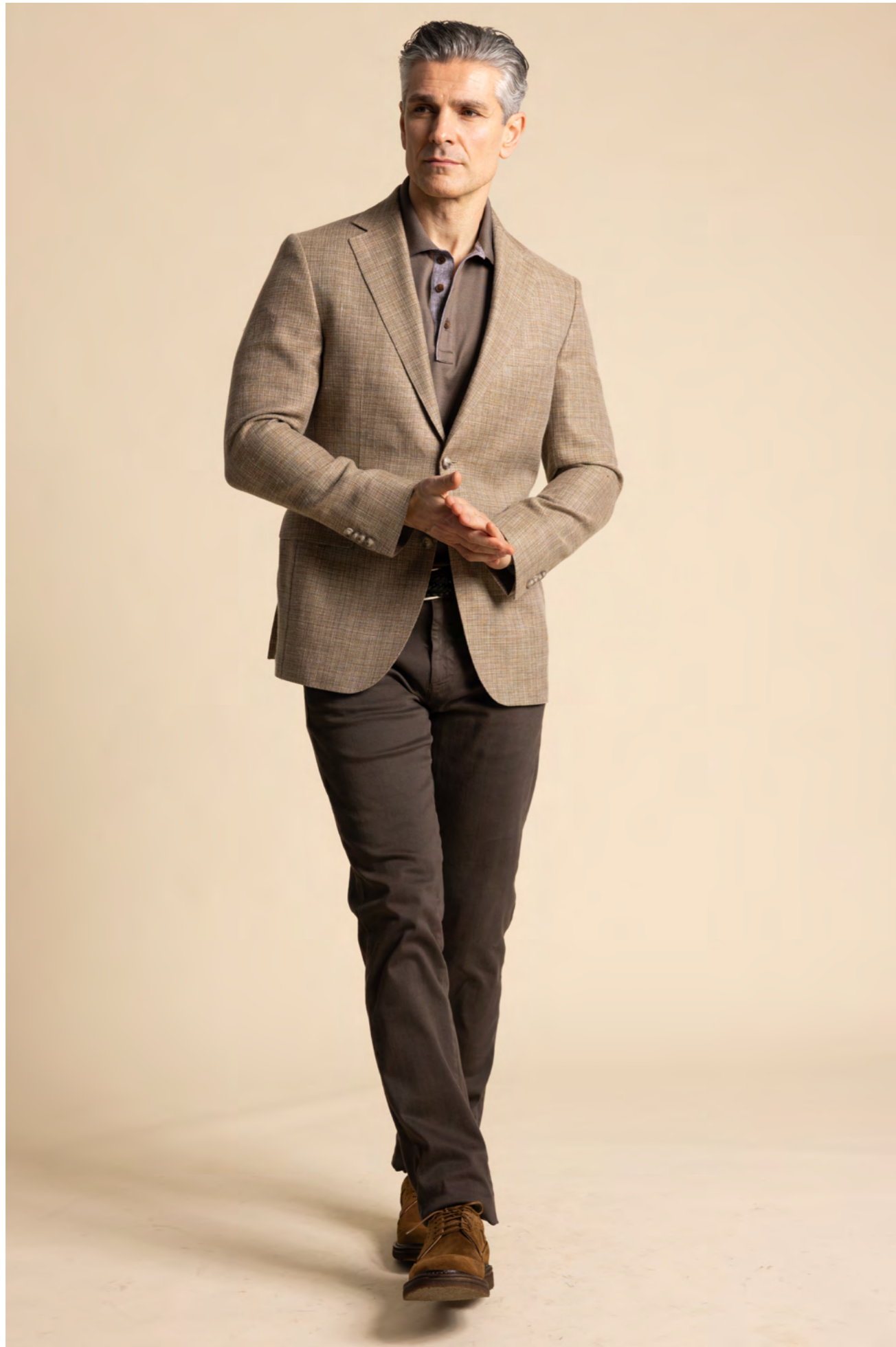
Dressler Blazer 5.000 kr.