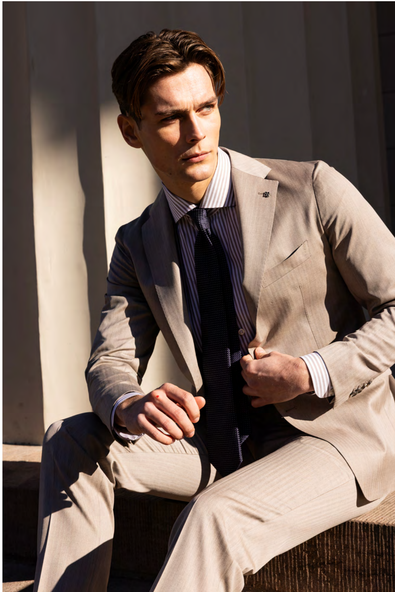
Tagliatore Jakkesæt 7.000 kr.