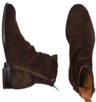
Elia Maurizi Ruskindsstovle 3.200 kr.