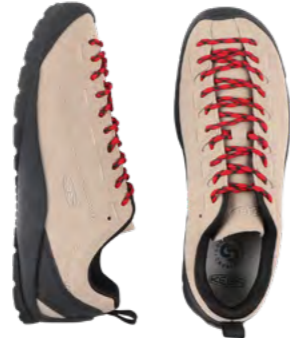
Keen Sneaker 1.000 kr.