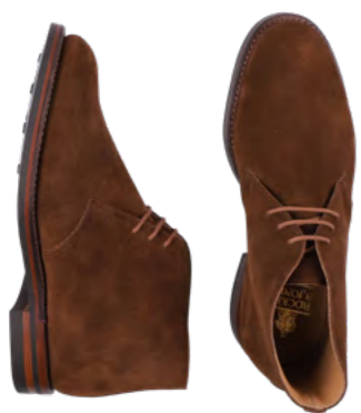
Crockett and Jones Chukka 5.400 kr.