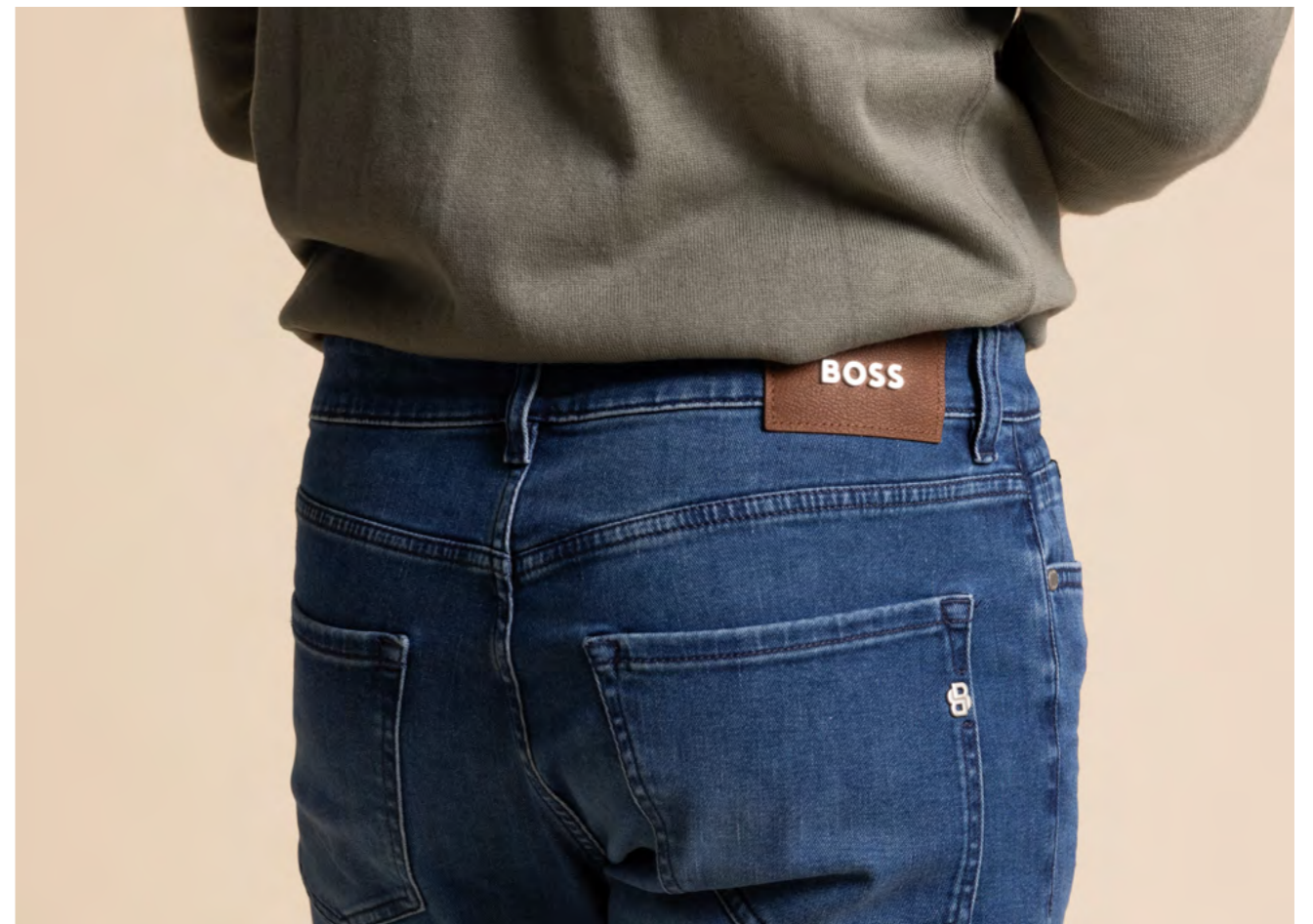
Brax 5-pocket 1.000 kr.