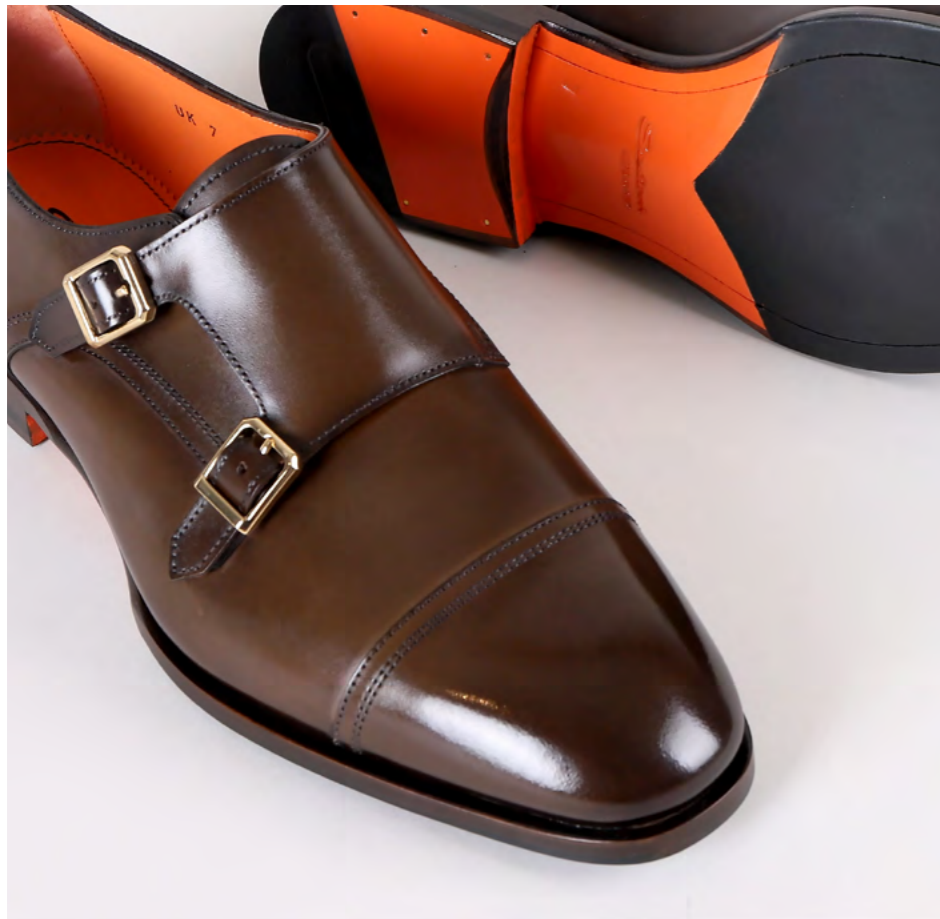
Santoni Dobuble buckle 5.800 kr.