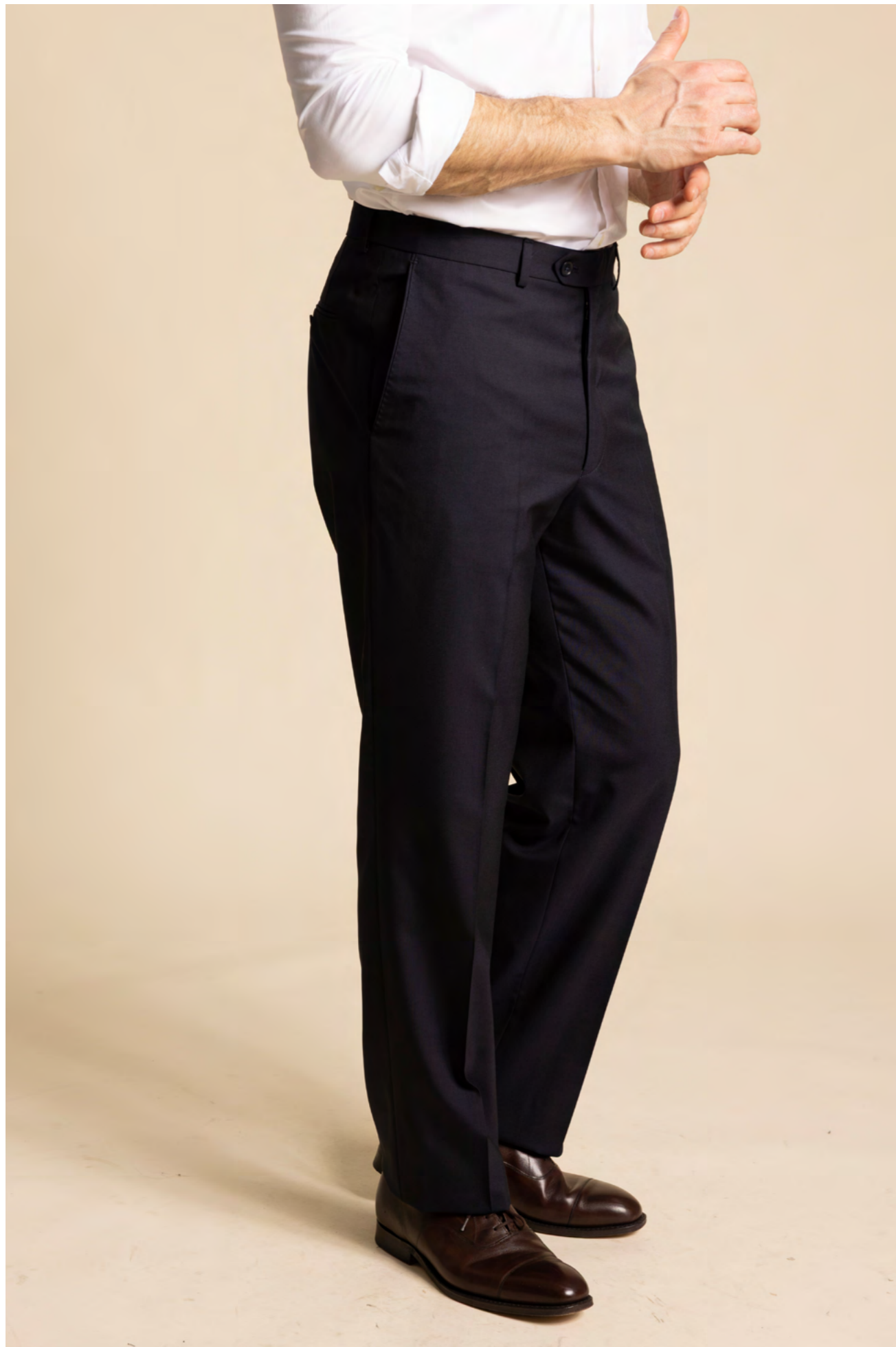
Oscar Jacobson Uldbukser 2000 kr.