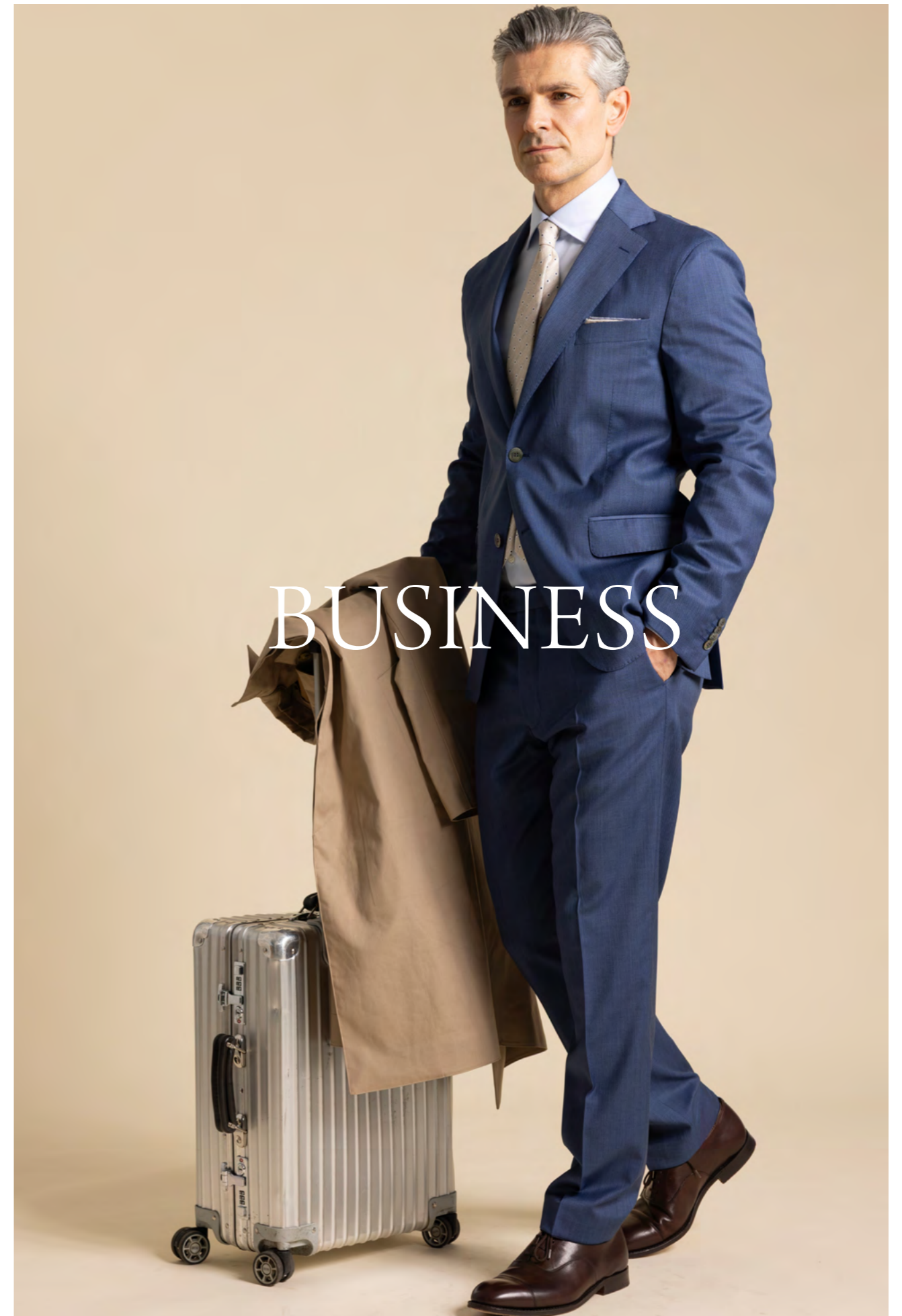
Tagliatore Jakkesæt 6.500 kr.