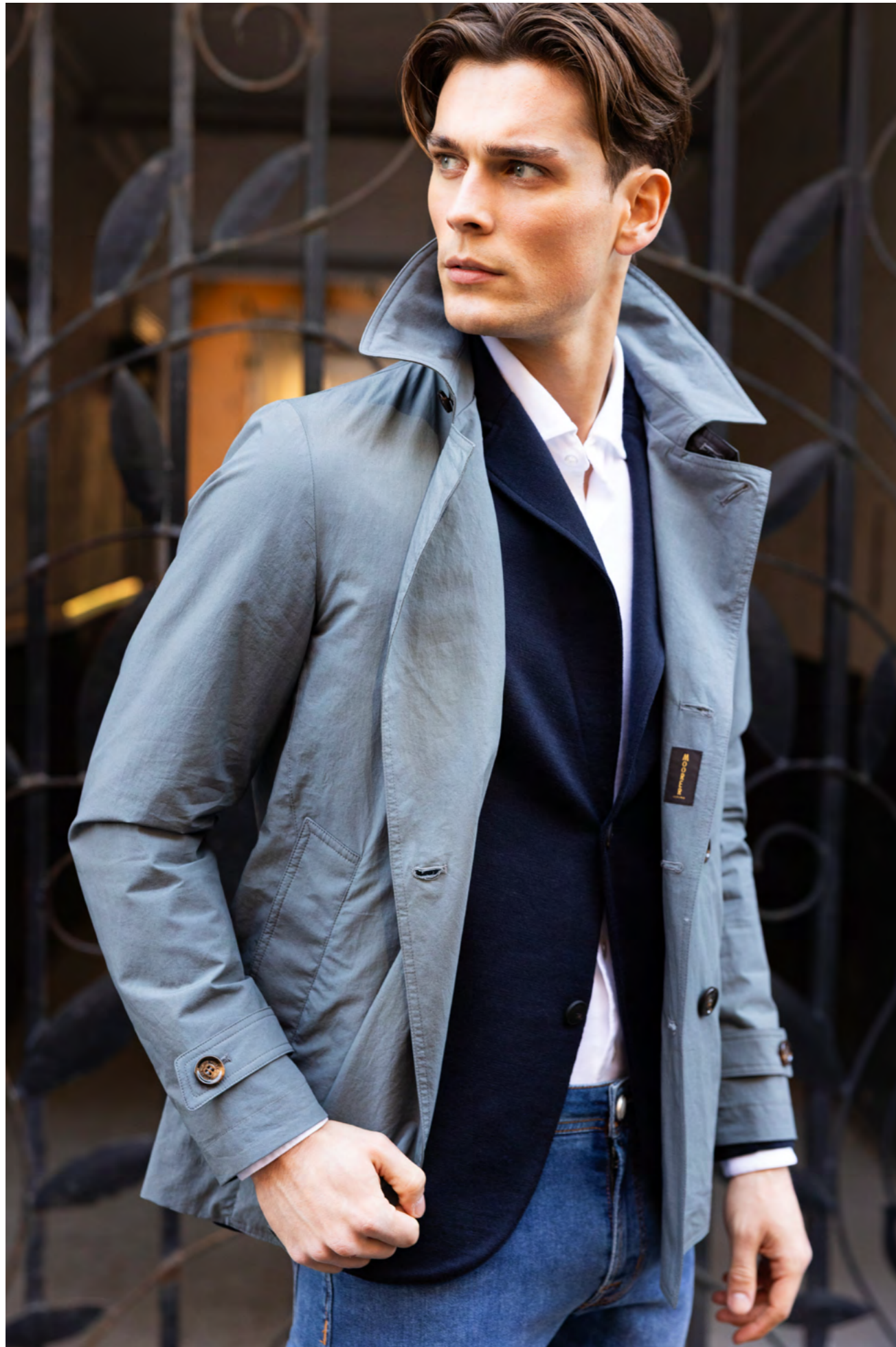
Moorer Jakke 8.600 kr.