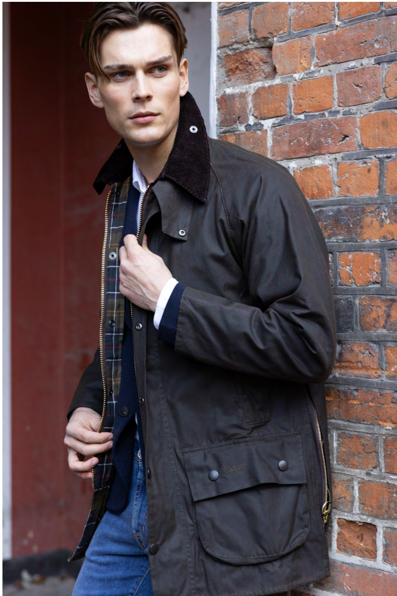
Barbour Jakke 3.200 kr.