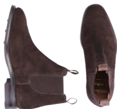
Loake Ruskind's chelsea boot 2.600 kr.