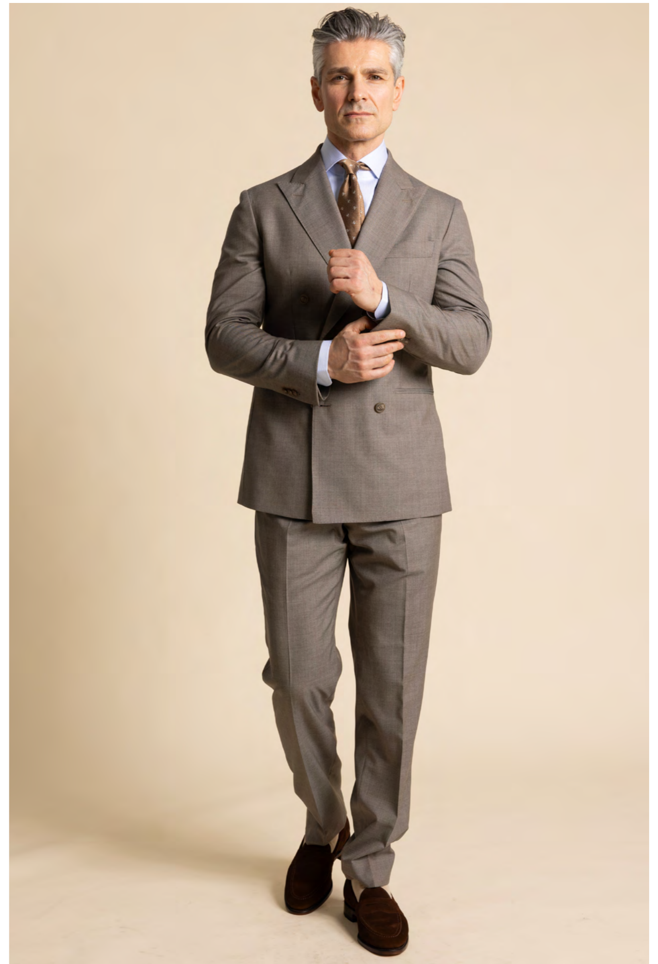
Troelstrup Jakkesæt 7.500 kr.