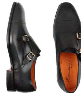
Santoni Lædersko 6.000 kr.