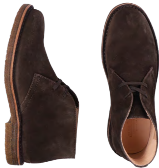
Astorflex Greenflex 1.599 kr.