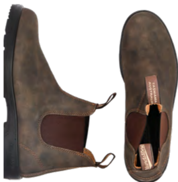
Blundstone Chelsea boot 1.500 kr.