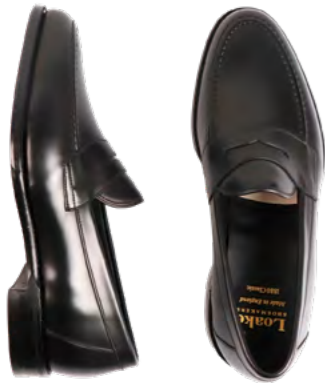
Loake Loafer 3.000 kr.