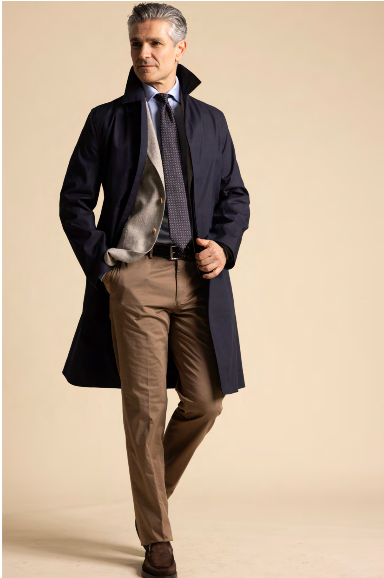
Mackintosh Frakke 7.500 kr.